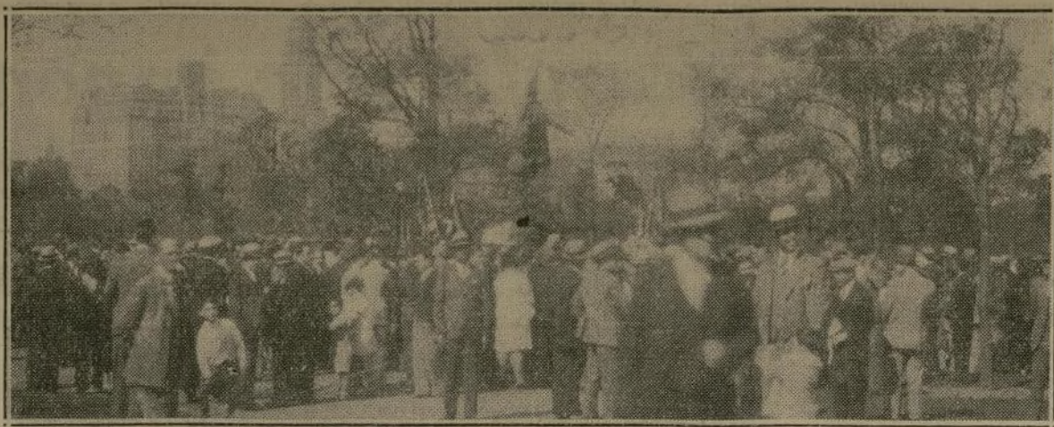
Aspecto que ofrecía la muchedumbre que rodea a la estatua de Cristóbal Colón durante la ceremonia de la "Fiesta de la Raza" ayer en Central Park.

LA GRAN MANIFESTACION DE AYER ANTE LA ESTATUA DE COLON