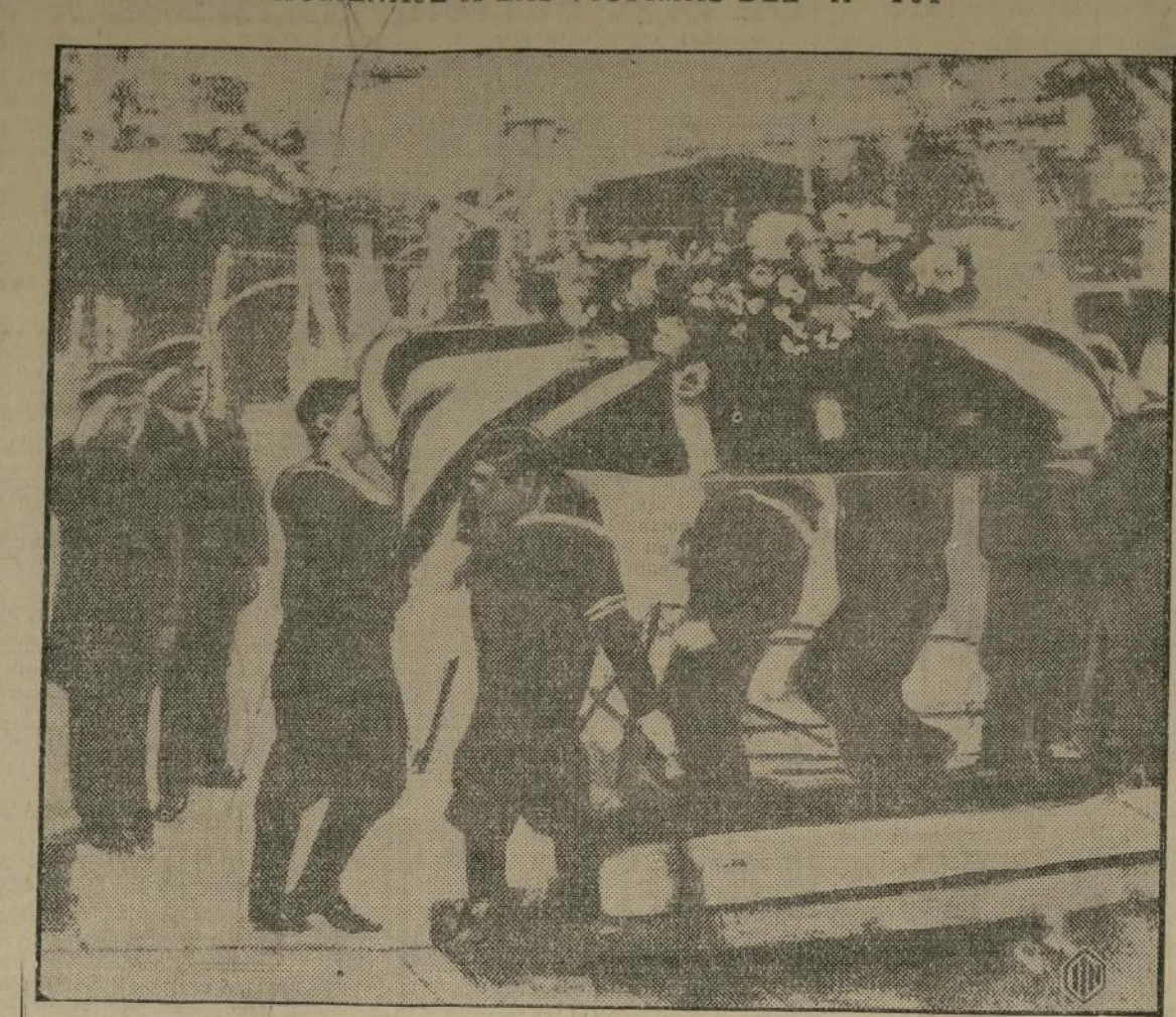
Marineros ingleses desembarcando en el puerto de Dover los ataúdes de las 47 víctimas del digno R-101 que tuvo recientemente un fin trágico en Francia. Todos los cuerpos fueron trasladados a Londres, donde serán enterrados juntos en el Cardington Air Field.