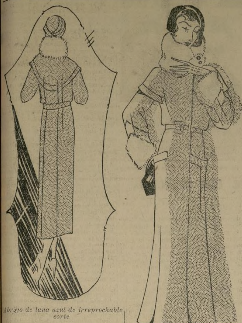
Figura de lana azul de irreproachable corte

NEW YORK, octubre 8.—¡Oh, qué lindo traje! Pero iba en un taxi a tomar el tren y no podía entretenerme en el trayecto. ¡Oh, oh! ¡Aquí está de nuevo! Y tampoco esta vez pude conseguirlo. ¡Mala suerte!