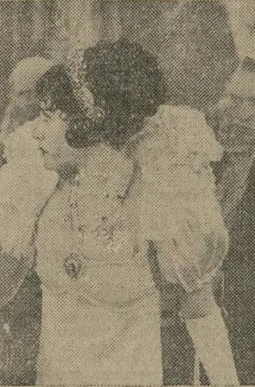
Bebe Daniels y Ralf Harold en un instante comprometedor de "Dixiana", la bellísima película que se exhibe en el "Jewel".