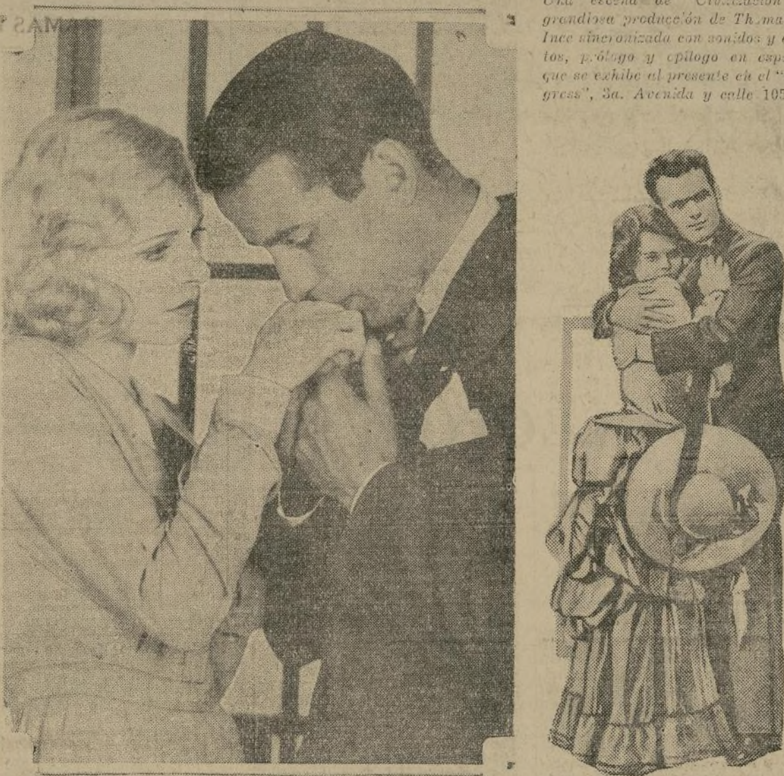
Despedida, la siempre triste despedida... Claire Luce y Humphrey Bogart en una escena de la película "Up the River", que se encuentra al presente en el "Roxy".