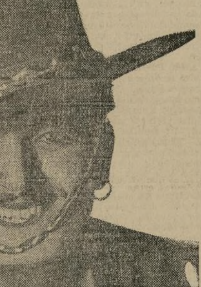
Douglas Fairbanks vuelve a sus admiradores en una de sus más gustadas películas, "Don Q", que empezará a exhibirse en el "Regent" mañana, hasta el viernes.

La Argentina, quien hizo anoche triunfalmente su "entrée" neoyorquina en el "Town Hall" con un soberbio programa.