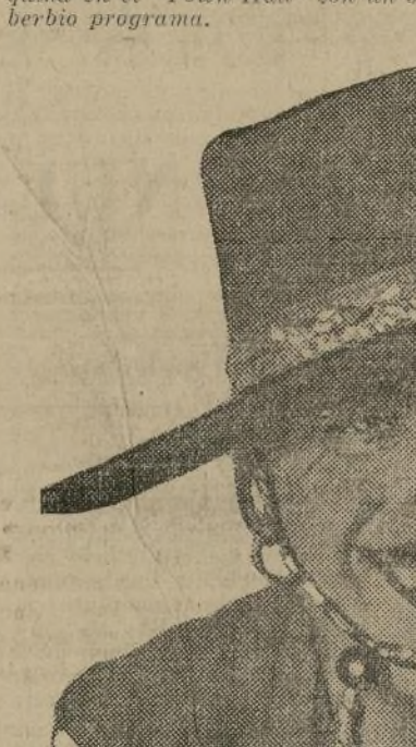
Douglas Fairbanks vuelve a sus admiradores en una de sus más gustadas películas, "Don Q", que empezará a exhibirse en el "Regent" mañana, hasta el viernes.

La Argentina, quien hizo anoche triunfalmente su "entrée" neoyorquina en el "Town Hall" con un soberbio programa.