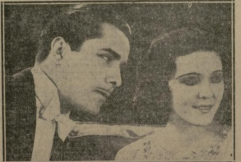
Don Alvarado y Raquel Torres, quienes, junto con Buster Keaton, encabezan el reparto de la graciosa comedia "Estrellados", que se empezará a exhibir el viernes por la noche en el teatro "San José".