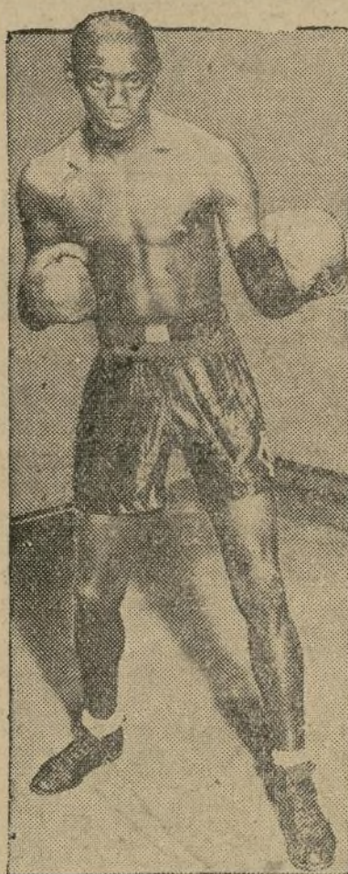
El "Kid" hará su reaparición esta noche en el Olympia Athletic Club de la calle 135.