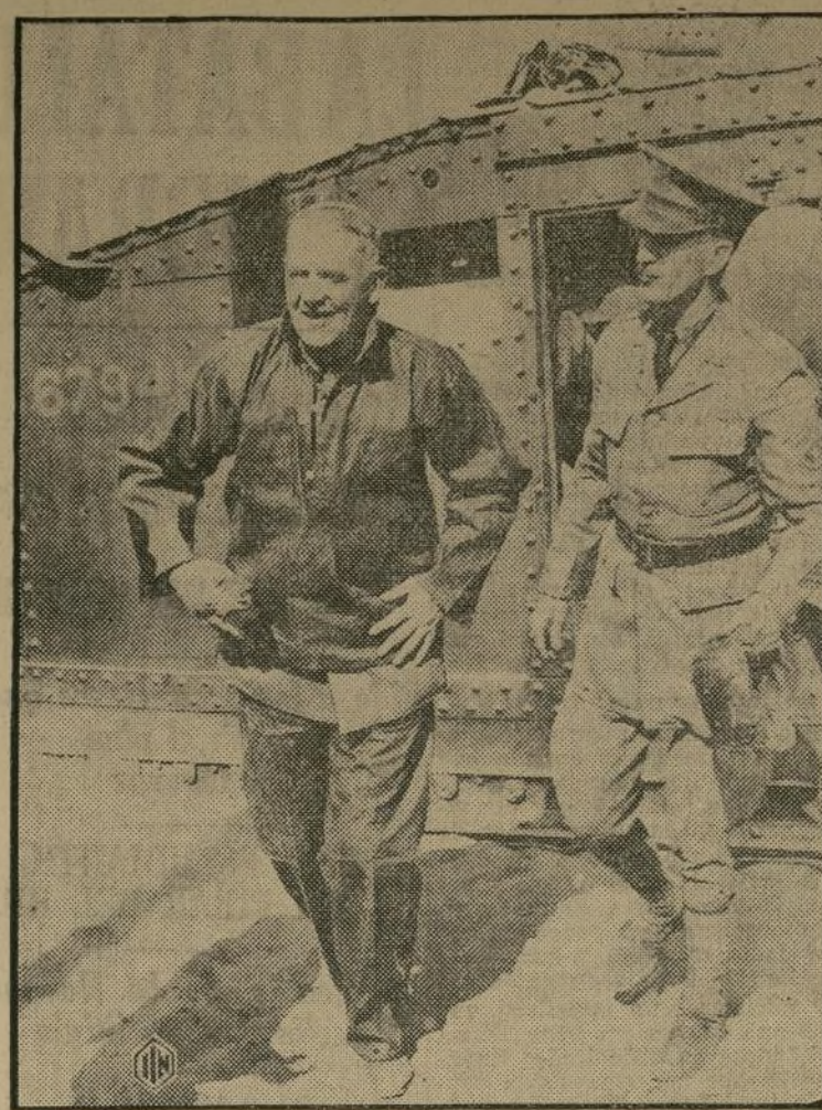
El teniente general von Blomberg, comandante de la primera división del ejército alemán durante su presente visita a Estados Unidos, estuvo en la escuela militar de West Point, donde inspeccionó los más modernos tanques de guerra que posee la nación.