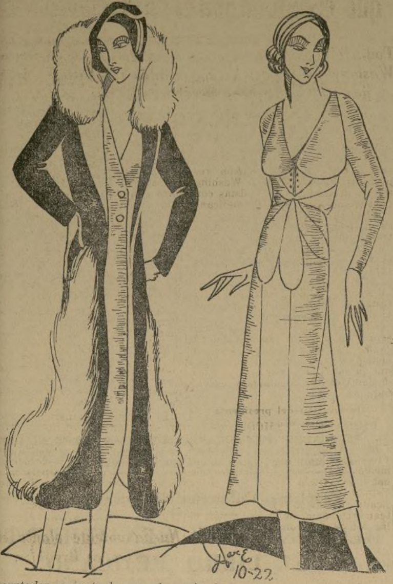
Encantador conjunto de pura elegancia, de raso blanco y lana marrón, con el abrigo profusamente adornado con piel de zorro beige.

NEW YORK, octubre 17.—Les dire por qué lo hacen. Nadie comprará un traje como éste, sino fuera por las tres o cuatro soberanas que aun quedan en Europa, o por las treinta o cuarenta reinas del teatro.