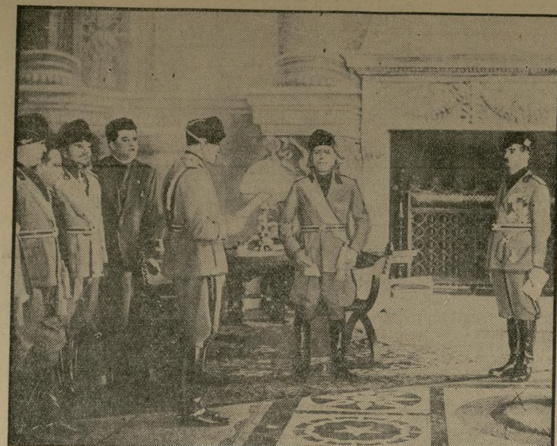
Acto de nombrar a Giovanni Giuratti, presidente de la cámara de diputados italiana, jefe supremo del partido fascista. En la fotografía aparece el primer ministro Mussolini (en el centro) oyendo la lectura del nombramiento. El señor Giuratti renunció a su puesto de presidente de la cámara de diputados para consagrar toda su atención a la jefatura de las fuerzas fascistas.