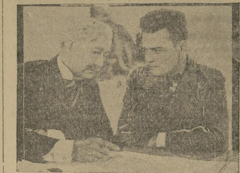
Una escena de la grandiosa película "All Quiet on the Western Front" que inolvidables escenas desfilan esta semana por el lienzo del "Regent."