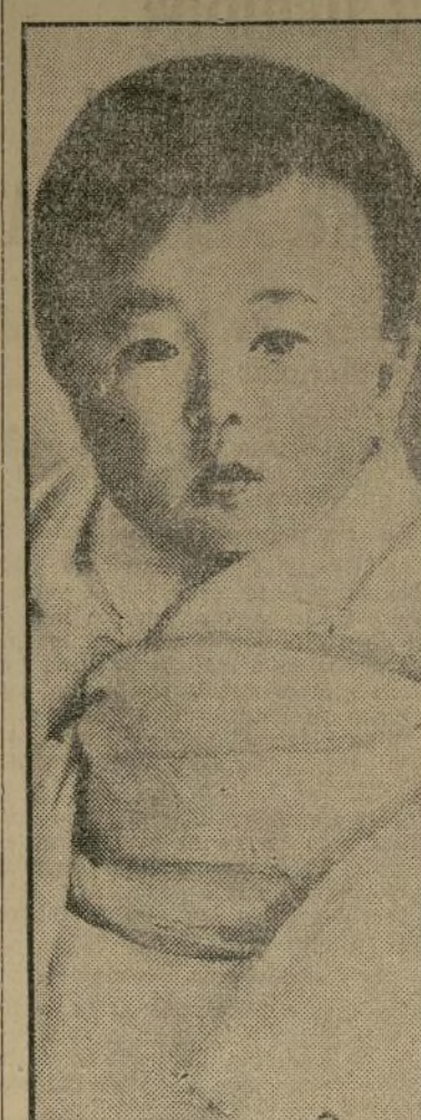
La pequeña princesa Taka, de un año de edad, hija de los emperadores del Japon, según un retrato que se le hizo el día 30 de septiembre, en que cumplió el primer año de su edad.