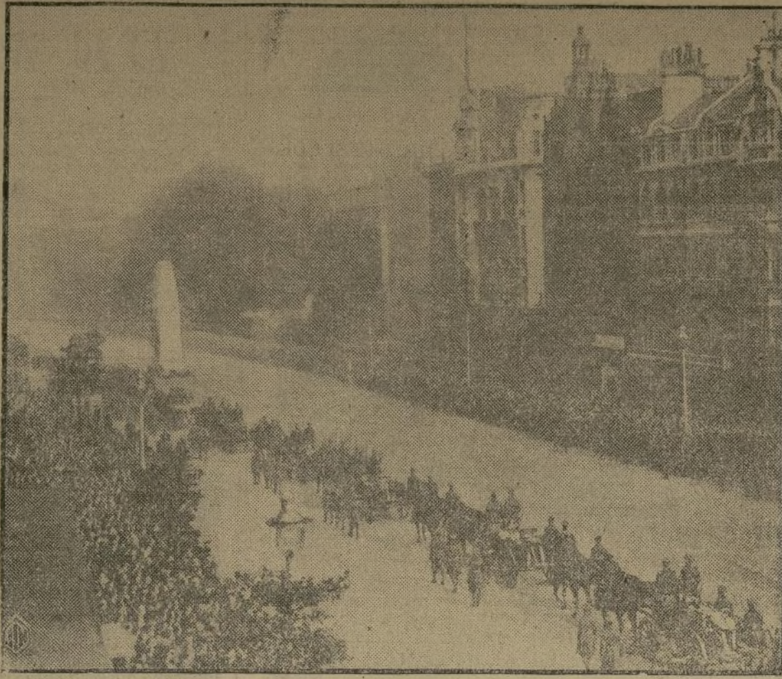
Los cadáveres de las cuarenta y ocho víctimas del desgraciado dirigible inglés "R-101" conducidos por las calles de Londres hacia su última morada en el campo de aviación de Cardington, donde fueron sepultados en una tumba común.