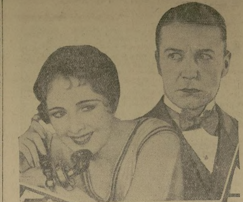
Billie Dove y Clive Brook aseguran en "Sweethearts and Wives" que hay una marcada diferencia entre novias y esposas. Y si queréis una mejor explicación de la teoría idá verlos al "Cosmo" cualquiera de estos días.