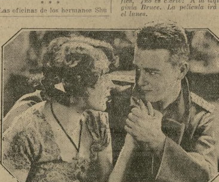
Romance y tragedia se mezclan en esta escena de amor de la grandiosa cinta "All Quiet on the Western Front", que empezará a exhibirse en el "Jewel" el próximo jueves.

bert son al presente teatro de gran actividad. Desafiando las condiciones críticas del momento, los empresarios están preparando varias obras musicales, dramas ingleses y piezas nacionales para su próxima presentación en sus elencos.