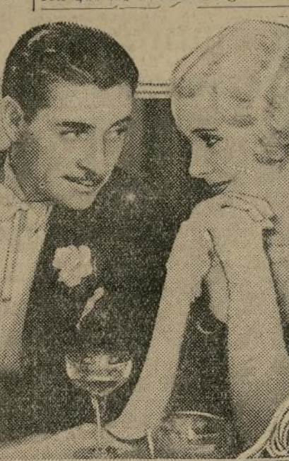
Envidiable situación la de Ronald Colman en esta escena de "Raffles", y no es cierto? A la izquierda Fay Wray y a la derecha Colman. La película irá al "Mount Morris" este sábado, hasta el lunes.

La situación política y económica de Alemania no disminuye el ardor con que los alemanes siguen trabajando.