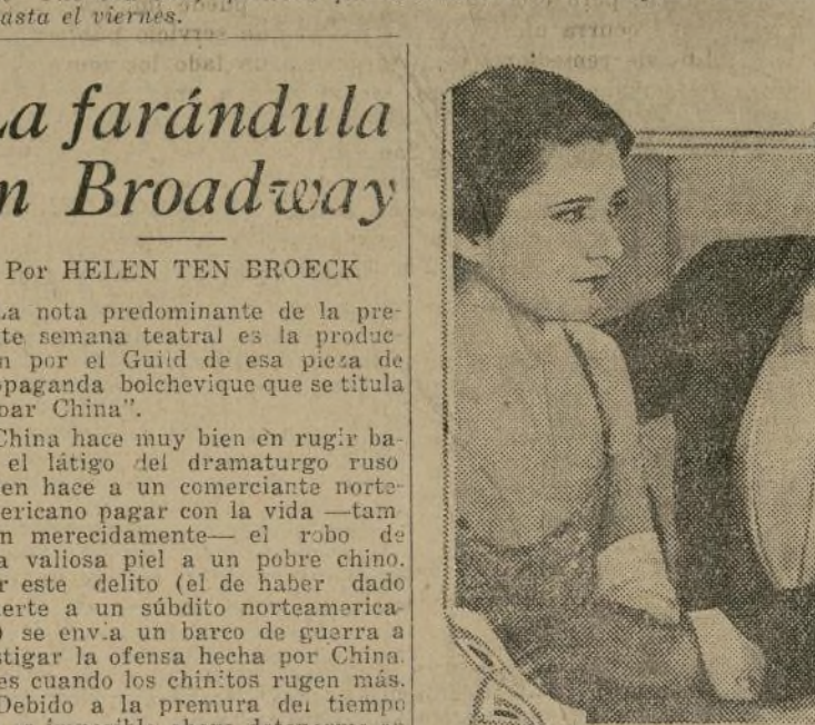
Envidiable situación la de Ronald Colman en esta escena de "Raffles", y no es cierto? A la izquierda Fay Wray y a la derecha Colman. La película irá al "Mount Morris" este sábado, hasta el lunes.