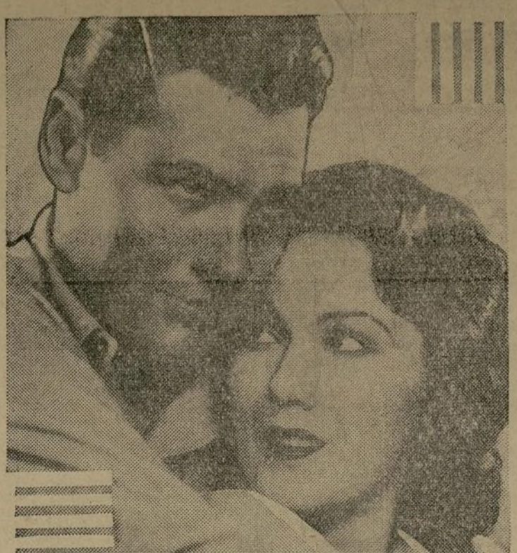
Richard Arlen (afortunado mortal) y Fay Wray en una escena de "The Sea God", película que se exhibirá en el "Regent" desde hoy hasta el viernes.