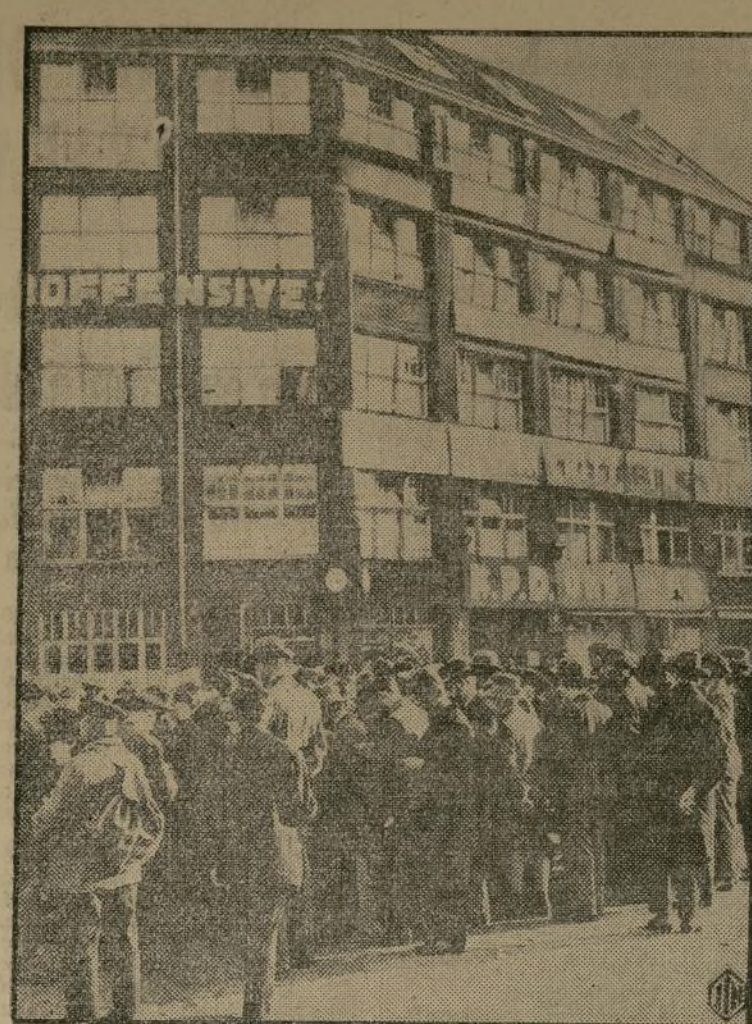
A los muchos problemas que la desocupación provoca en Alemania hay ahora que agregar la reciente huelga de ciento cincuenta mil obreros metalúrgicos en Berlín, de los cuales puede verse un grupo en el presente grabado.