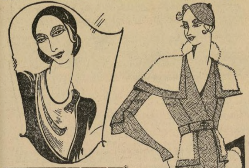
Adorable abrigo de piel, adornado con piel lisa y manguito que hace juego

¿Cuáles son los géneros más dedicados y elegantes para la lencería otoñal? Empecemos con el negligee, deslumbrador, exquisitamente femenino, frívolo, exótico. Confeccionado en terciopelo de más suave tejido y bonitos matices; lamé dorado y plateado, vaporosos chifones y encajes, en colores rosa, durazno y en toda la gama de tonalidades, sin olvidar el lila, orquídea, coral y principalmente el azul.