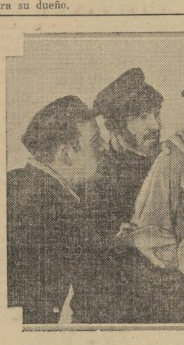
Charles Bickford y Constance Cummings en una escena de "The Last Man", hermosa película que se empieza a exhibir hoy a la cabeza del programa del "Loew" de la calle 116.

"Buster" (William) Collier Jr., y Joan Marsh están gozando la mar en el yate de John Barrymore en el cual la Columbia filmó "Obeced la Ley". El yate Barrymore, llamado "The Mariner", es indudablemente el más famoso de Hollywood por las fiestas que en él celebra su dueño.