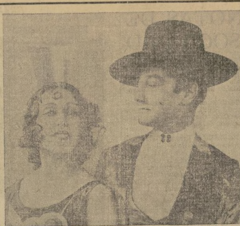
El extraordinario y único Escudero en uno de sus inimitables bailes junto con una de sus dos lindas compañeras, a quienes Nueva York podrá admirar de nuevo la noche del domingo próximo en el teatro "Chamán", en su única presentación aquí antes de emprender una extensa gira por el resto del país.