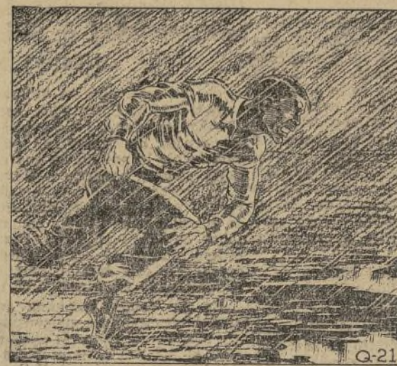
La vida de Van Roon parecía hechizada. Los tres que se disputaban el amor y el poder, los tres que se disputaban el amor y el poder, los tres que se disputaban el amor y el poder.