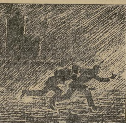
Calma. Petrie, calma! gritó el capitán. Calma, Petrie, calma! gritó el capitán. Calma, Petrie, calma! gritó el capitán.