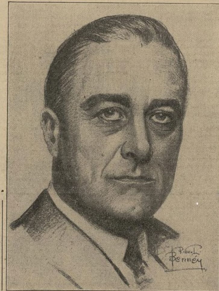
El Hon. Franklin D. Roosevelt candidato demócrata para presidente de los Estados Unidos.

Este mensaje de confraternidad va dirigido a Uds., nuestros nuevos hermanos norteamericanos, ciudadanos extranjeros naturalizados. Para Uds., el ideal de Norte América es la fresca y vivida concepción hacia la realización de una ideología cuya brillante ejecutoria ni el tiempo ni los hechos pueden empañar.