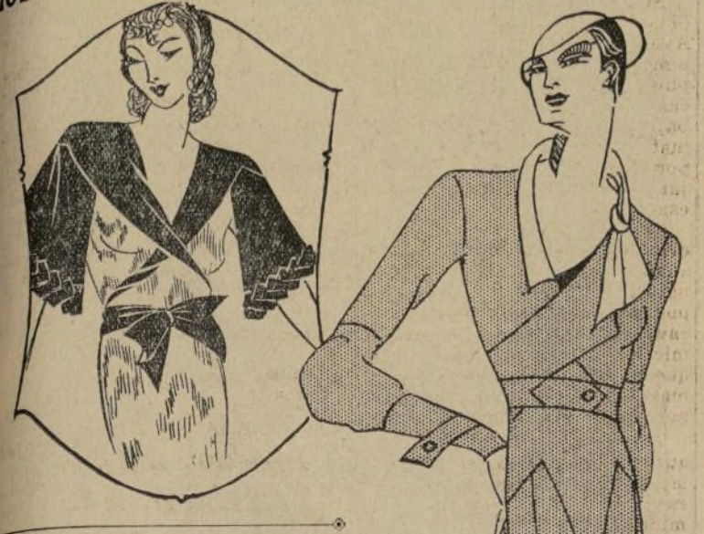
Elegante modelo de Martial et Armand, en lana roja con cuello blanco

Los vestidos usados por las artistas de teatro y las de cine requieren especial confección y colorido. Deben ofrecer un brillante efecto de color y elegancia. Si es para una bailarina o para cualquier otra clase de arte, debe adecuarse, pintoresco, que muestre la figura poniendo de relieve sus encantos. La casa de Worth, en París, tiene un salón de modas llamado el "Salón de Teatro", especial para la confección de vestidos para las artistas. Son una maravilla de color, diseño, ejecución y material. Miss Ludmila, la famosa bailarina de la Chicago Opera, posee trajes de esta casa, que reúnen todos los detalles más acabados de belleza y buen gusto.