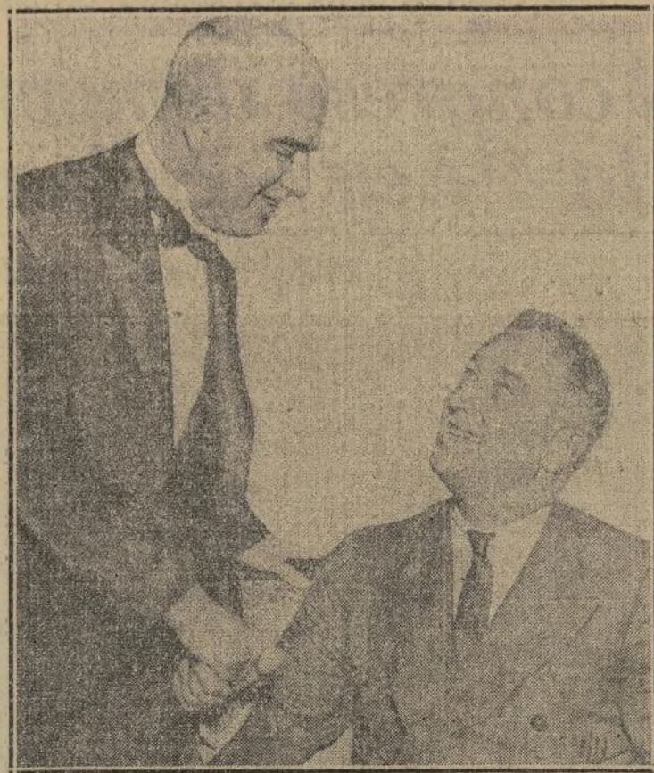
La primera persona en felicitar al gobernador Franklin D. Roosevelt en su elección a la presidencia fue su teniente gobernador y gobernador electo de New York, el coronel Herbert H. Lehman. Mr. Lehman prestaba visita a Mr. Roosevelt en su residencia para mostrarle los primeros escríptos recibidos cuando fue tomada esta fotografía.