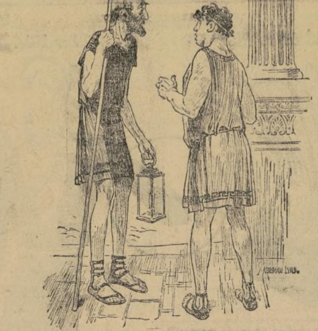
Micheópolis: ¿Qué hora tenéis en vuestro reloj? Diógenes: Acabo de venir de Chicago y no tengo reloj.