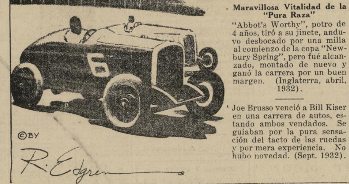
Maravillosa Vitalidad de la "Pura Raza"

"Abbot's Worthy", potro de 4 años, tiró a su jinete, anduvo desbocado por una milla al comienzo de la copa "Newbury Spring", pero fué alcanzado, montado de nuevo y ganó la carrera por un buen margen. (Inglaterra, abril, 1932).