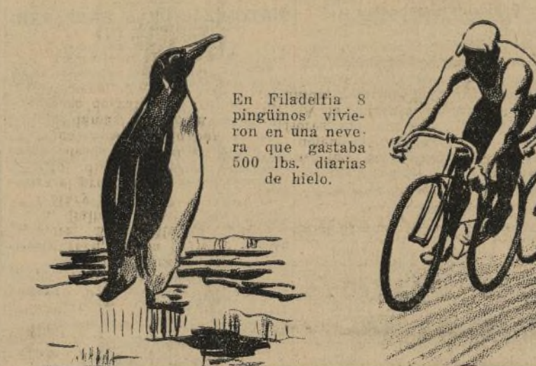
En Filadelfia 8 pingüinos vivieron en una nevera 500 lbs. diarias de hielo.