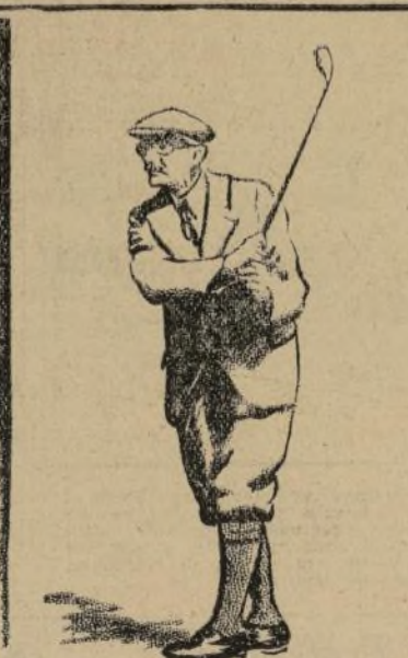
28 jugadores de la clase "A", de 75 y más años, compitieron por el campeonato "senior" del país en el Aramisco Club. Había 2 jugadores de 85 años cada uno. (1932).