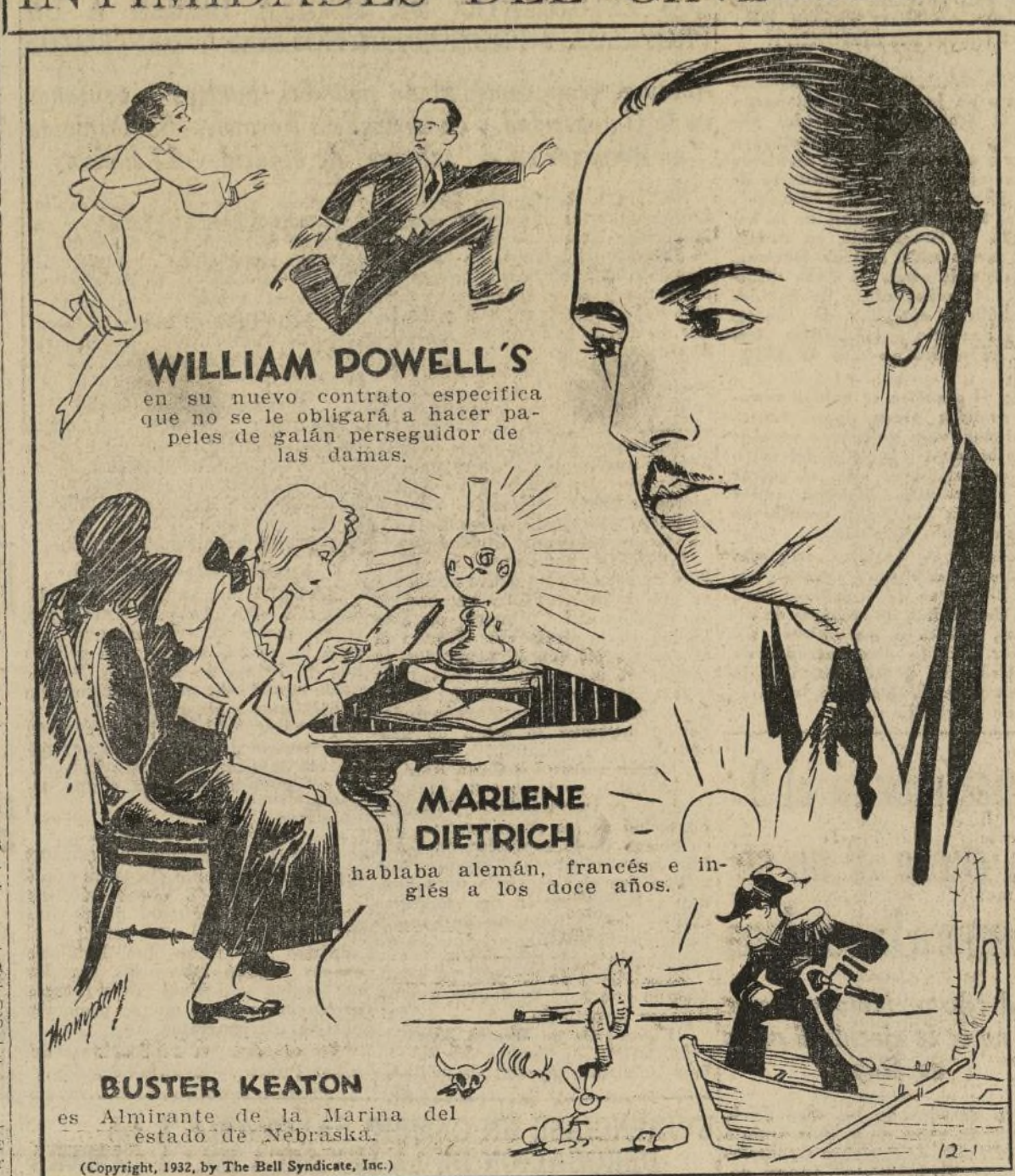
WILLIAM POWELL'S en su nuevo contrato especifica que no se le obligará a hacer paños de galán perseguidor de las damas.