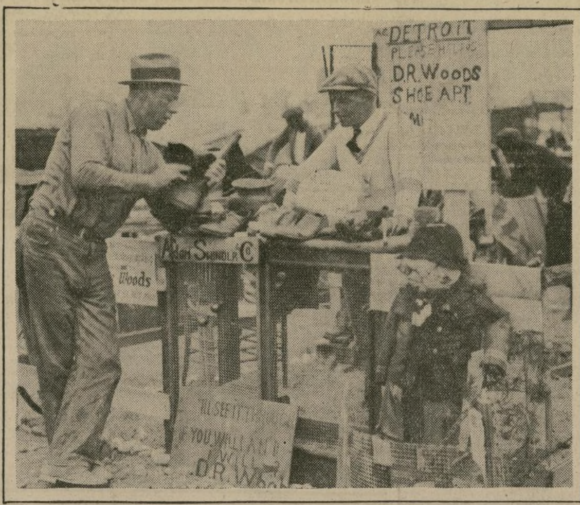
La desolación realmente deprimente que se respira en el campamento de los veteranos movilizados en Washington para pedir el pago del bono de guerra, destaca más en los episodios pintorescos como el que reproduce el grabado. Una tienda de vitallares organizada por un grupo de veteranos de Detroit para vender toda clase de artículos — a precios bajos — a sus camaradas.