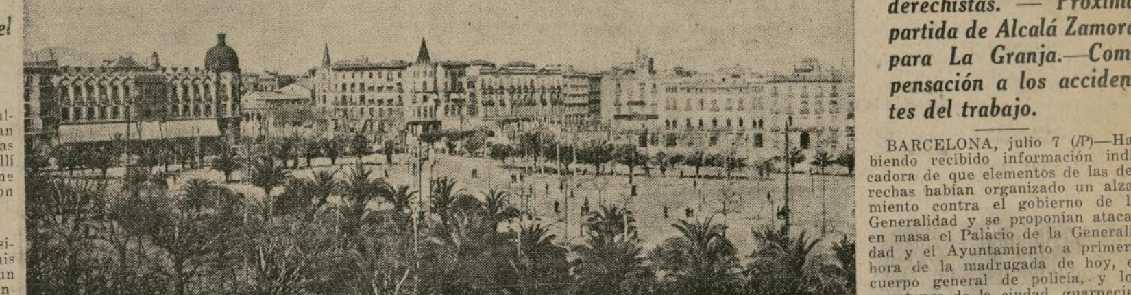
La Plaza de Cataluña de Barcelona que con el distrito de la Generalidad y el Ayuntamiento estuvo custodiada ayer por las fuerzas públicas.

EL CONSEJO DE GUERRA DE CUBA CONDENA A LA SEÑORA MENDOZA A 14 AÑOS DE PRISION