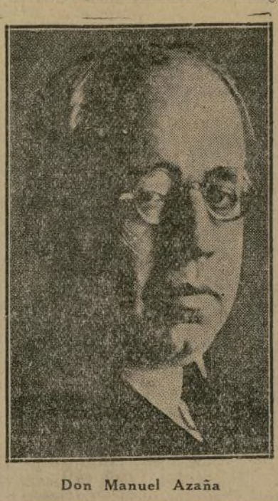
Don Manuel Azaña