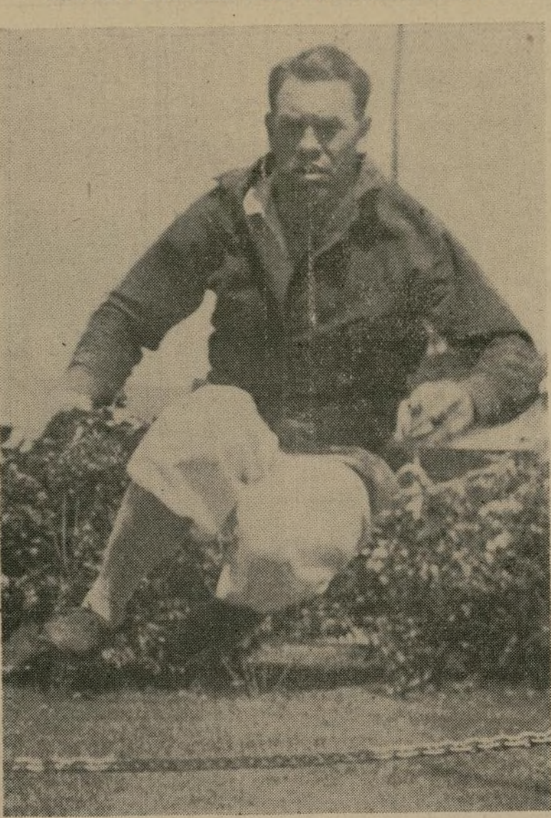
Paulino Uzcudun en un rato de recreo durante su intenso "training" en Pompton Lakes, N. J., para su próximo combate con Ernie Schaff en el estadio del Madison Square Garden. Este combate corresponde a las nuevas eliminatorias de Jimmy Johnston para producir un nuevo "match" por el campeonato mundial para septiembre próximo, y Paulino demuestra cómo espera salvar su primer obstáculo.