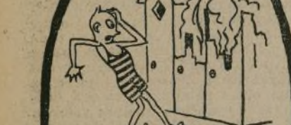
"Perdió su camisa" en el incendio de Coney Island