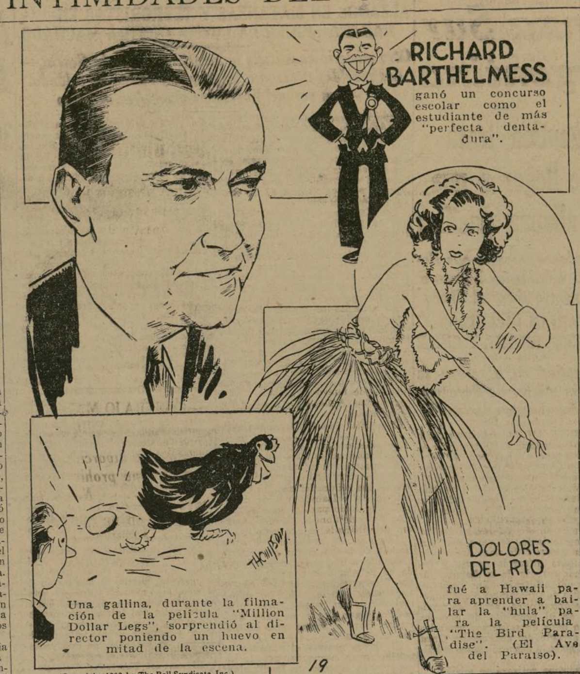
Una gallina, durante la filmación de la película "Million Dollar Legs", sorprendió al director poniendo un huevo en mitad de la escena.