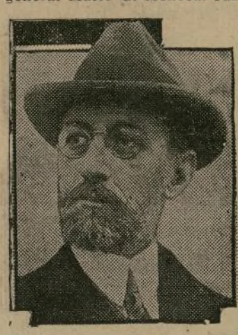
General Mario G. Menocal

PARIS, julio 27 (AP).—La Compagnie Générale Transatlantique ha confirmado hoy la partida del ex-presidente de Cuba, mayor general Mario G. Menocal rumbo a Nueva York. El ex-presidente embarcó sin hacer conocer su viaje más que a un grupo de íntimos, anoche, a bordo del vapor "Lafayette".