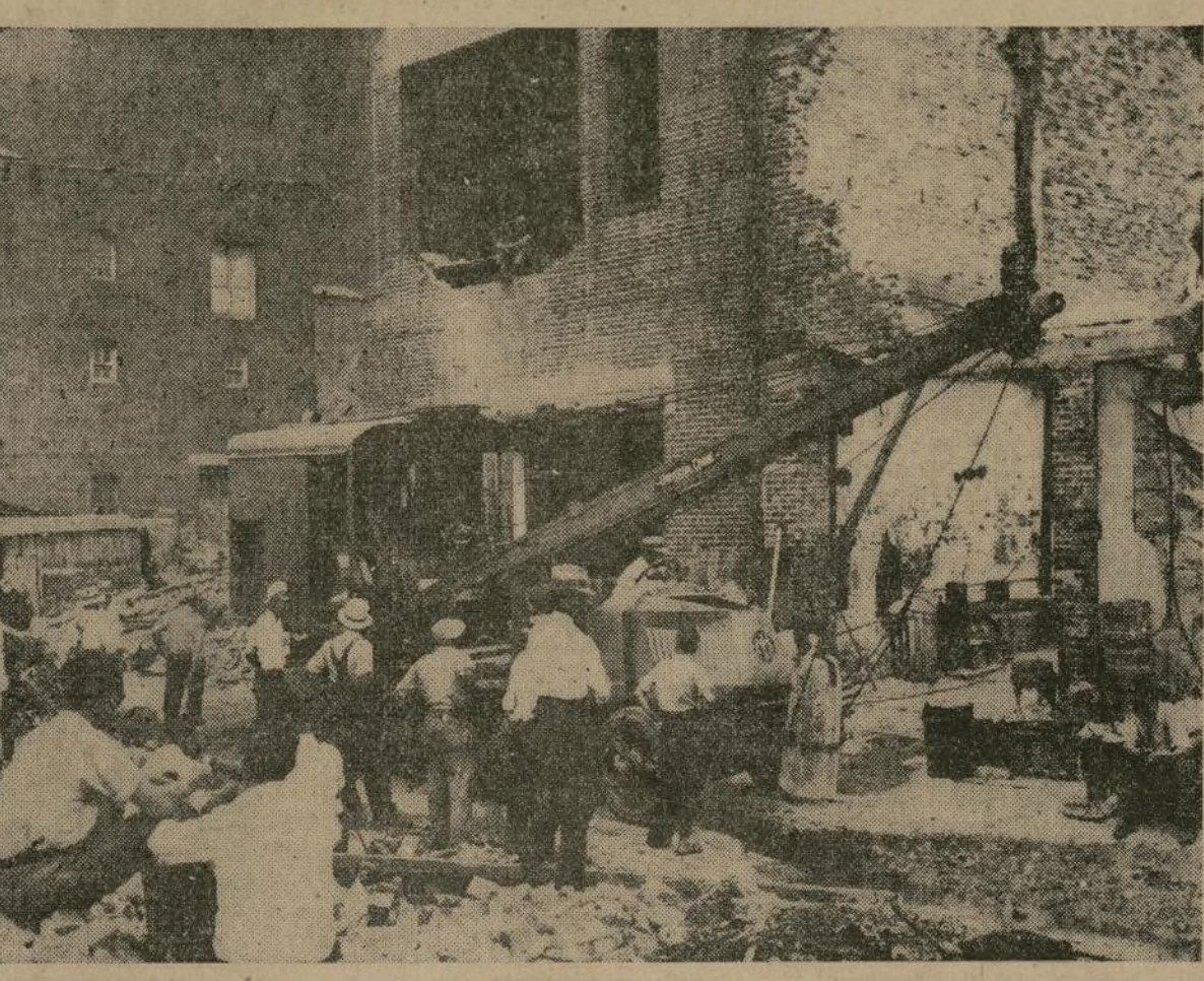
He aquí el edificio, en proceso de demolición, de donde se expulsaba ayer a los veteranos, que lo habían convertido en albergue, en Washington, cuando se produjo el sangriento choque.