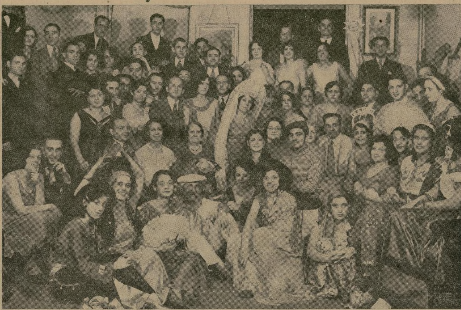
Grupo de concurrentes al festival que con extraordinaria animación celebró esta agrupación el sábado por la noche, y en el cual tomaron parte connotados elementos de nuestras colonias

LUCIDO BAILE DE DISFRACES DEL CLUB RAMONA