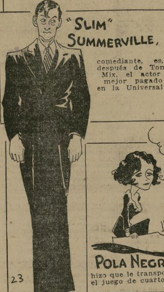
"SLIM" SUMMERVILLE, comediante, es, después de Tom Mix, el actor mejor pagado en la Universal.

es irlandés y holandés de Pennsylvania y sabe algunas palabras en sueco, pero recibe muchísima correspondencia de admiradores escandinavos.