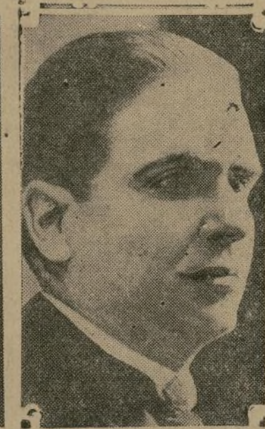
Dr. José P. Cuggiari Presidente del Paraguay