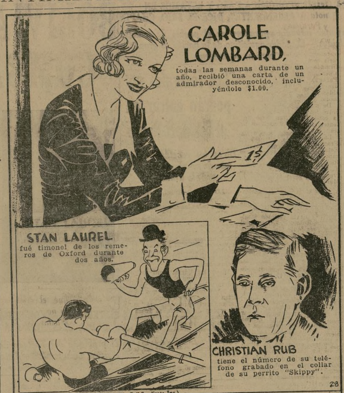
STAN LAUREL fué timonel de los remos de Oxford durante dos años.