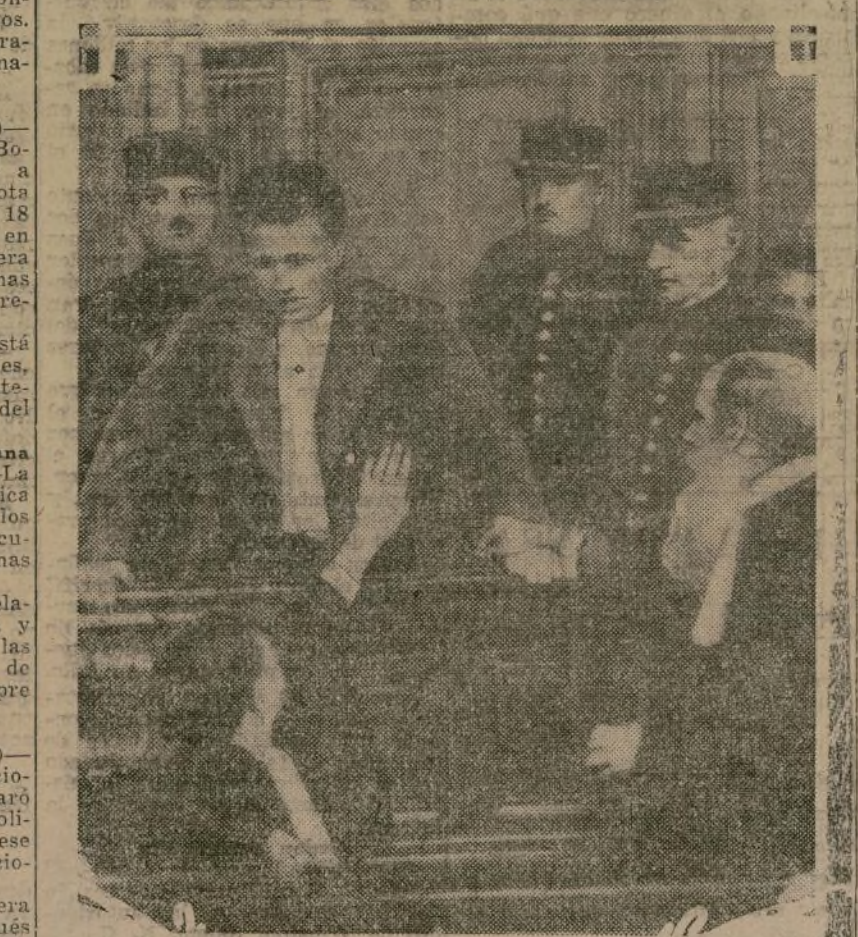
Después de haber sido condenado a morir en la guillotina en París por haber muerto al presidente de Francia, monsieur Paul Doumer, Paul Gorguloff hace una dramática y fútil apelación ante la corte que lo sentenció. Nótese cómo los abogados del reo tratan de clemarlo.