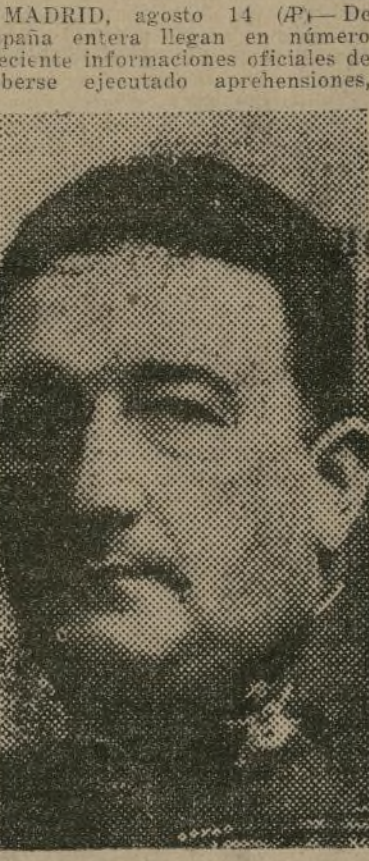
General Federico Berenguer

Ramiro de Maeztu preso con otros monárquicos. — Pena de muerte contra el general Sanjurjo. — Monárquicos a la Guineá. — Recompensa a los leales