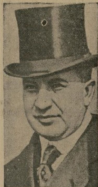
Doctor Eusebio Ayala, presidente del Paraguay

recientemente había capturado en presencia de una patrulla paraguaya. Texto de la última nota boliviana. LA PAZ, Bolivia, agosto 14 (A).—El siguiente es el texto de la última nota-respuesta de la cancillería boliviana a los neutrales: "Hemos recibido su cablegrama fecha 9 del mes en curso en el cual los representantes de los 5 países neutrales despus de algunas consideraciones sobre enunciados anteriores, nos hacen la siguiente declaración: 'La inmediata cesación de las hostilidades'." "Sin entrar a examinar dichas consideraciones, no todas ellas de nuestra conformidad, respondemos en los términos siguientes: 'Primero, Bolivia se ratifica en su contraproposición de tomar por base para el acuerdo el momento actual, conforme a las prácticas del derecho internacional; y se permite observar que el día 1.º de junio de 1932 no existía ninguna situación jurídica en el Chaco como parecen creerlo los neutrales'." (Sigue en la segunda página)