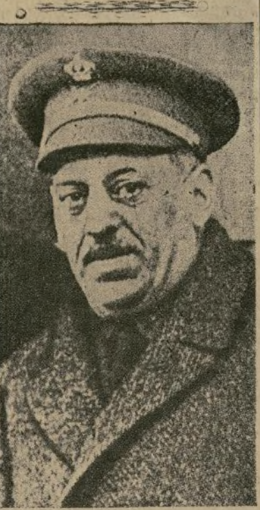
General José Sanjurjo

Nueva concentración boliviana ASUNCION, Paraguay, agosto 24 (P).—El comandante paraguayo de la primera división del ejército ha informado al ministro de la Guerra,