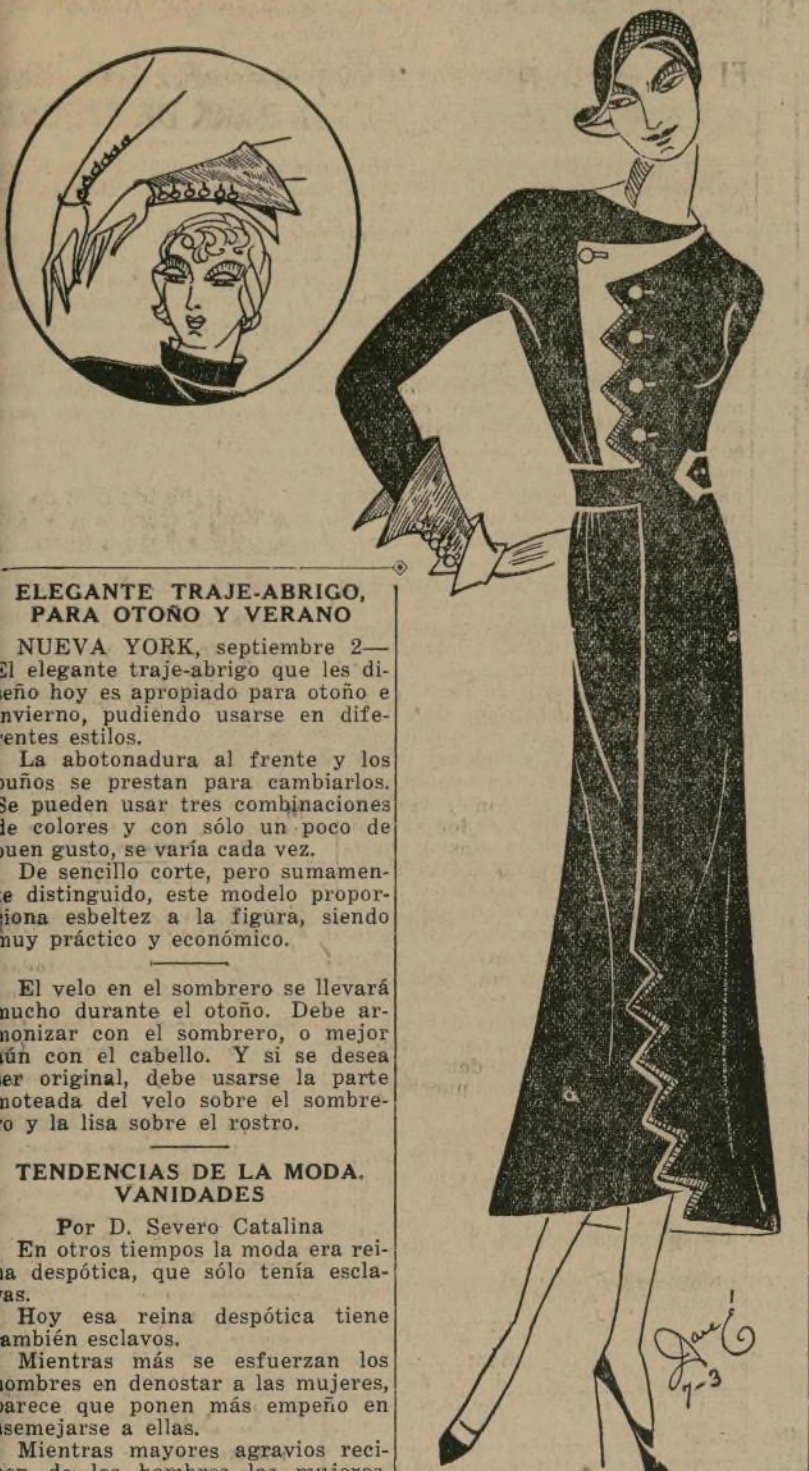
ELEGANTE TRAJE-ABRIGO, PARA OTONO Y VERANO

NUEVA YORK, septiembre 2.—El elegante traje-abrigo que les diseño hoy es apropiado para otoño e invierno, pudiendo usarse en diferentes estilos.