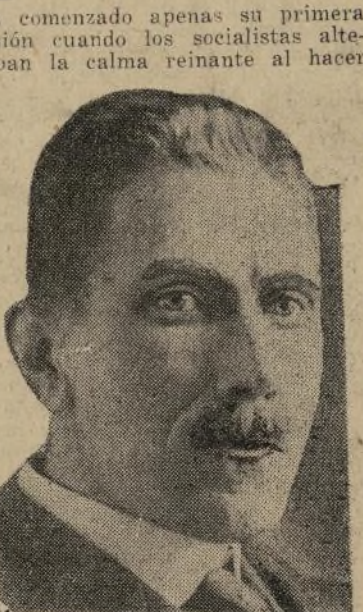
Canciller Franz von Pappen

una moción encaminada a que los decretos de emergencia expedidos por el gobierno de von Pappen fueran derogados. No hubo objeción y de acuerdo con la legislación de la cámara baja ello implicaba la moción debía ser debatida inmediatamente. El líder socialista nacional entonces hizo proposición de receso de la sesión por media hora para considerar en camarilla de pasillo la inesperada situación presentada. Ello significaba que el primer mensaje