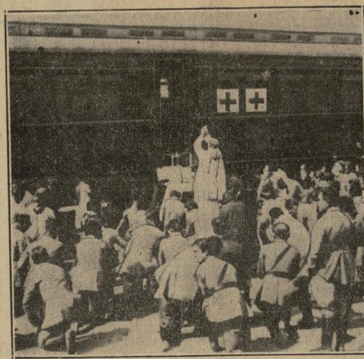
Un contingente de tropas federales brasileñas antes de partir para el estado de São Paulo, oye misa al aire libre en la estación del ferrocarril de Río de Janeiro. Estas mismas tropas, más tarde, fueron trasladadas al estado de Minas Geraes, en donde también lucharon con los sublevados.