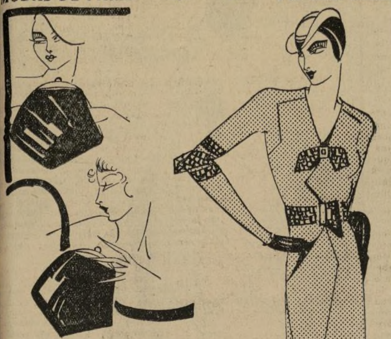
Traje para otoño de tweed rojo con adornos en piel de cocodrilo tejida de rojo

Las carteras que se llevan bajo el brazo continúan siendo las más populares para el diario. Deben ser amplias y flexibles, pues las de apariencia rígida están fuera de moda. El mango queda cubierto por la piel, teniendo bolsillos ocultos, y si queda el mango visible, es muy delicado y pequeño.