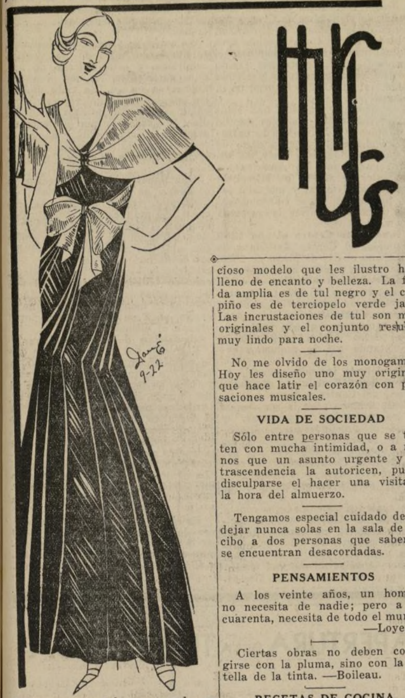
Encantador modelo para noche en tul negro y terciopelo verde jade

Por BEATRIZ SANDOVAL MODAS DE PARIS Por Mlle. DARE