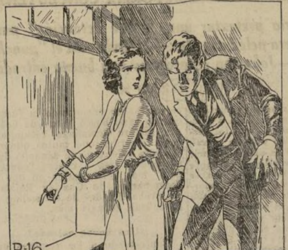
De la ventana de un primer piso miráramos... Comenzó a hablar la cuerda y, mirando arriba...