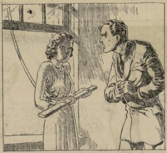
Atiende a la cuerda, venía otra más fuerte, que a su vez fue subida por sobre los alambres...