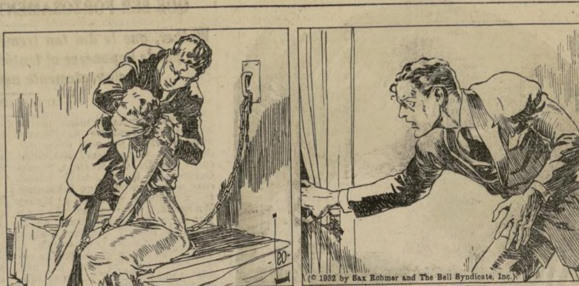
Las pisadas sonaban corriendo en descenso por el escenario. Escuchó la voz de Fu Manchu dando órdenes con rapidez y determinación. Venían hacia él. Aterrado el músico se bajó...