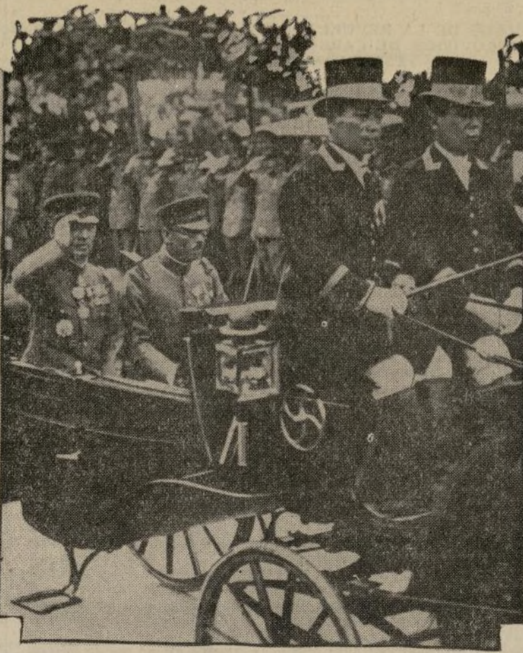
Cuando el general Sigeru Honjo (saludando) regresó recientemente a Tokio después de haber estado durante tres años al mando de las fuerzas niponas, fué objeto de una clamorosa recepción por el pueblo de la capital japonesa, que lo ovacionó desde la estación del ferrocarril hasta el palacio imperial, donde fué recibido por el soberano.