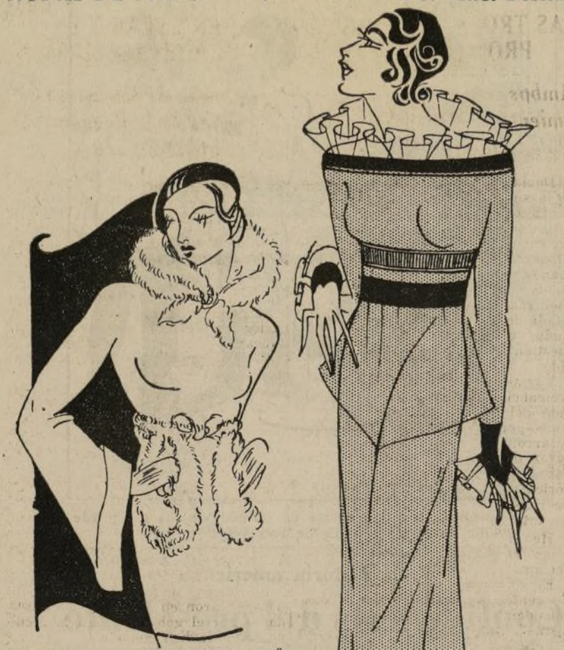
Traje muy chic en crepé de lana gris, con puños y cuello en organdi azul pálido y cinturón doble de cabritilla azul pálido

Algunas de las novedades de la nueva estación se mencionan en la última carta de Mamzelle y consisten en detalles como éste: guantes hasta la muñeca, adornados con motas bordadas en hilo de seda. Y los guantes de cabritilla azul pálido, combinados con azul más oscuro son muy elegantes. Los guantes blancos tienen su toque de rojo, por lo regular en motas y los beige en marroñ.