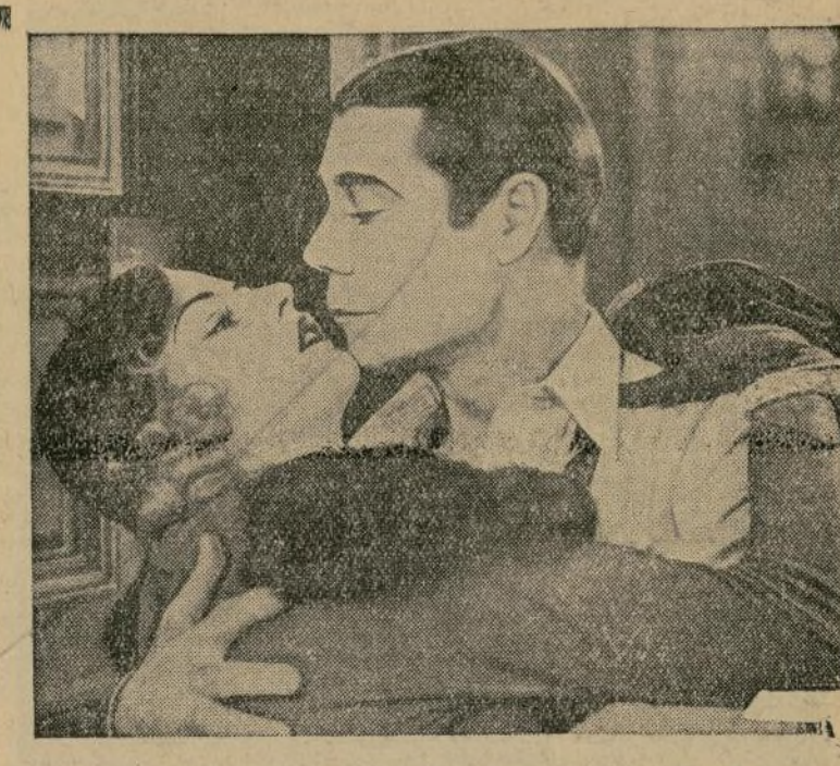
¿Cómo iba a resistirse ella a la seducción de este hombre extraordinario? Y Joe E. Brown triunfó en toda la línea como hombre y como amante en "Fireman, Save My Child", la graciosa comedia que empieza a exhibirse mañana en el "Bunny".

Winter Garden.—Si usted aficionado a las carreras de caballos y al mismo tiempo le gustan las películas de acción, no deje de ver "The Crowd Roars", con James Cagney, que sigue en este teatro.