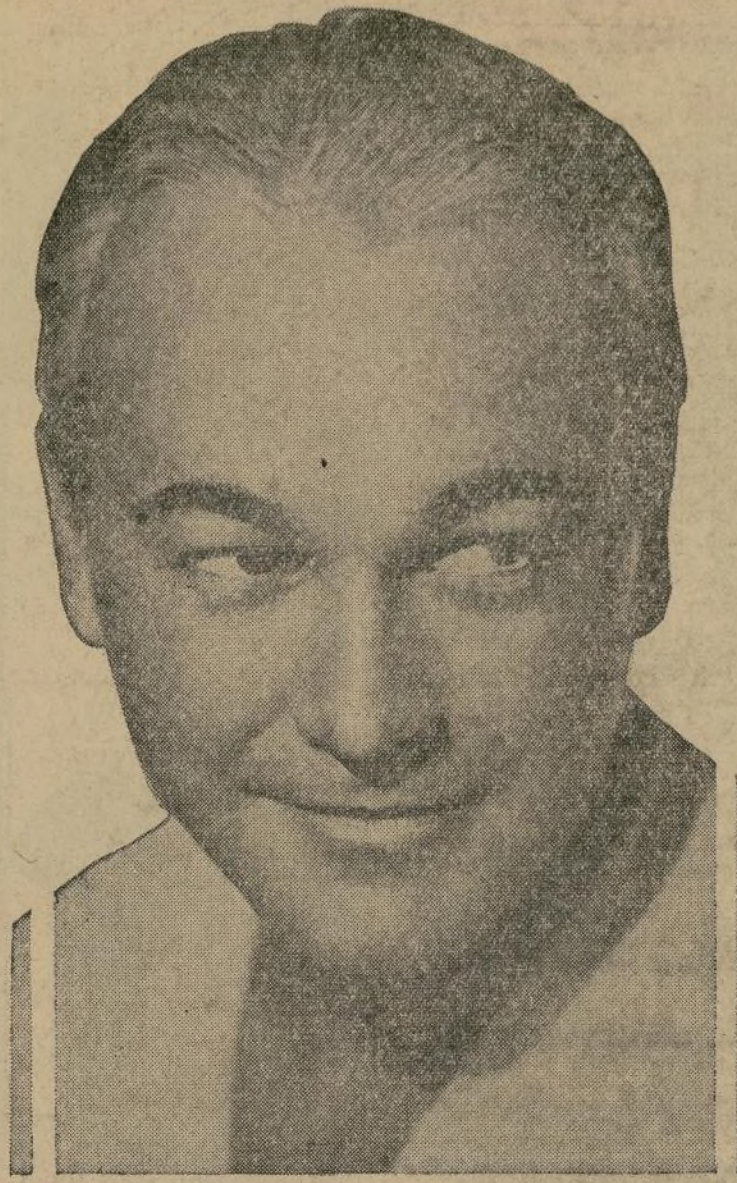
Bill Boyd, protagonista de la emocionante producción "Carnival Boat", que ponen en la pantalla hoy simultáneamente los teatros "Hamilton" y "Regent".