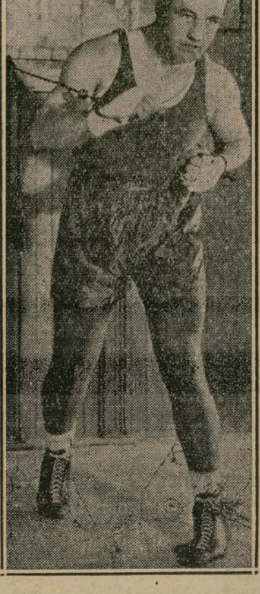
Jack Sharkey ha empezado ya a prepararse en Orangeburg, N. Y., para su combate por el título con Max Schmeling en el Garden Stadium el 21 de junio próximo.

ARGENTINA ORDENA LA IMPRESION DE LOS BONOS DEL EMPRESTIMO PATRIOTICO Servicio especial de LA PRENSA BUENOS AIRES, mayo 17. — El gobierno ha ordenado que se proceda de inmediato a la impresión de los bonos que serán emitidos para el empréstito patriótico argentino, sancionado ya definitivamente por el congreso. La emisión de estos bonos se hará en series de cincuenta o cien millones de pesos cada una. La aprobación del empréstito patriótico es un nuevo y poderoso estímulo para el gobierno argentino para lograr el equilibrio del presupuesto y para continuar manteniendo la presente situación favorable del crédito nacional. Los bonos estarán sujetos a la aprobación de una comisión especial nombrada para la administración del empréstito patriótico, podrán ser presentados para su redención en la Caja de Conversión, hasta un 85 por ciento de su valor nominal, siempre y cuando tales operaciones no lleven a la garantía de oro a un nivel bajo el 36 por ciento. La ley estipula las condiciones concretas de acuerdo con las cuales el circulante emitido por la Caja de Conversión será redimido por medio de la expedición de bonos para la distribución en el público. Varias instituciones importantes han votado ya considerables asignaciones para subscripción de los bonos del empréstito patriótico. Según todas las indicaciones el empréstito será recibido del modo más favorable en el público.