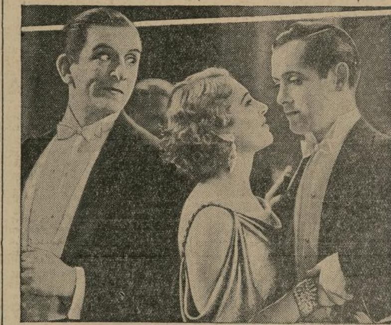
Edward Everett Horton, Nora Gregor y Robert Montgomery, personajes principales de "But the Flesh is Weak", que se empieza a exhibir hoy en el "Loew" de la 116.

El programa de variedades que se dará en la noche del viernes en el "luncheon" que le ofrece el "Advertising Club".