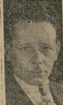
Chile Mapocho Acuña

Una idea justa y amenazadora de la resolución con la que este elemento criminal de habla española de aquí, se ha asimilado a las desenfrenadas prácticas de sus colegas de la peor especie de Nueva York, cuando me tuve yo mismo