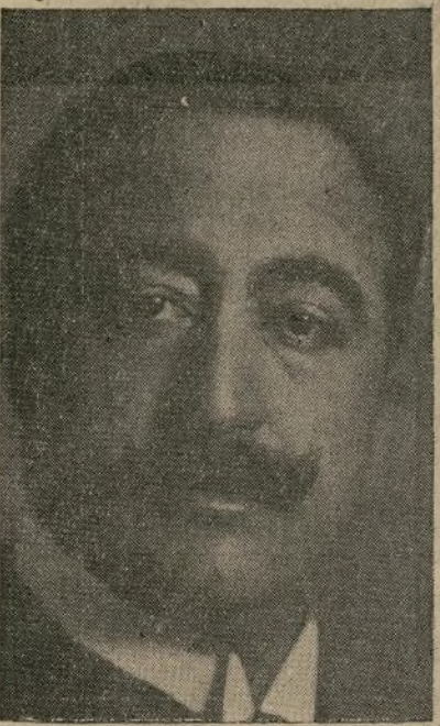
Dr. Orestes Ferrara

Servicio especial de LA PRENSA HABANA, junio 1.—La situación política permanece sin ninguna variación de importancia. El general Mario García Menocal y sus compañeros siguen refugiados en la le-