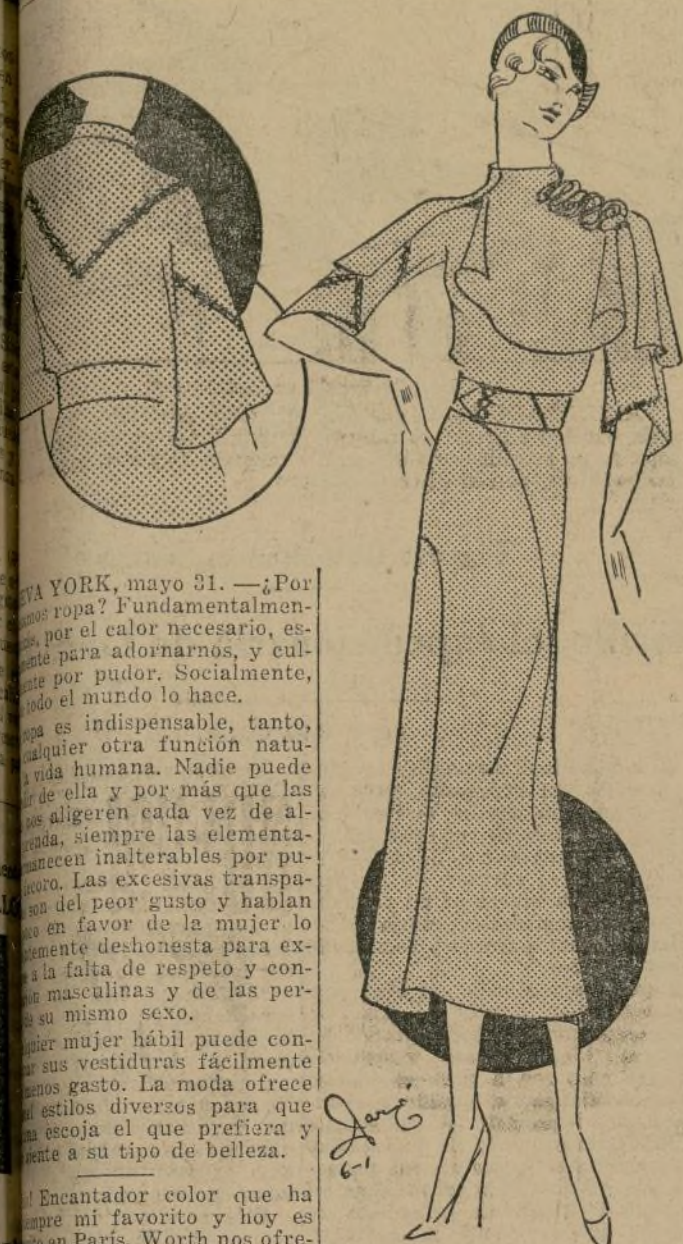
Elegante vestido en dos tonos grises.

más obscuro. Puede llevarse sin la esclavina, haciendo dos vestidos. No les parece adorable?