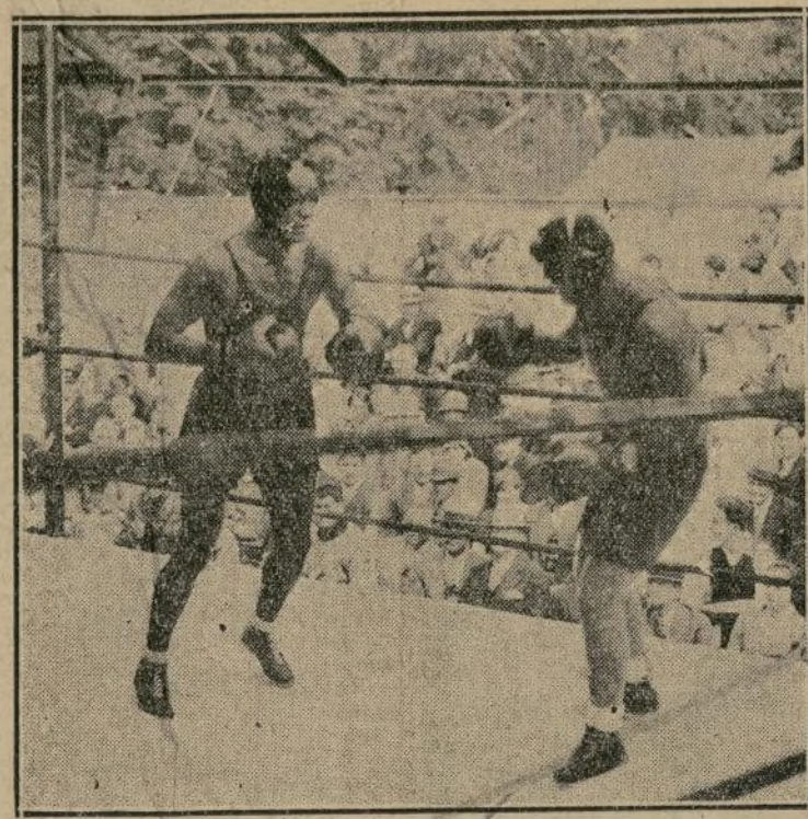
Max Schmeling (izquierda) aparece aquí durante una sesión de guantes con uno de sus "sparring-partners" en Kingston, N. Y., donde se enfrenta para su encuentro con Jack Sharkey por el campeonato mundial el 21 de junio próximo.