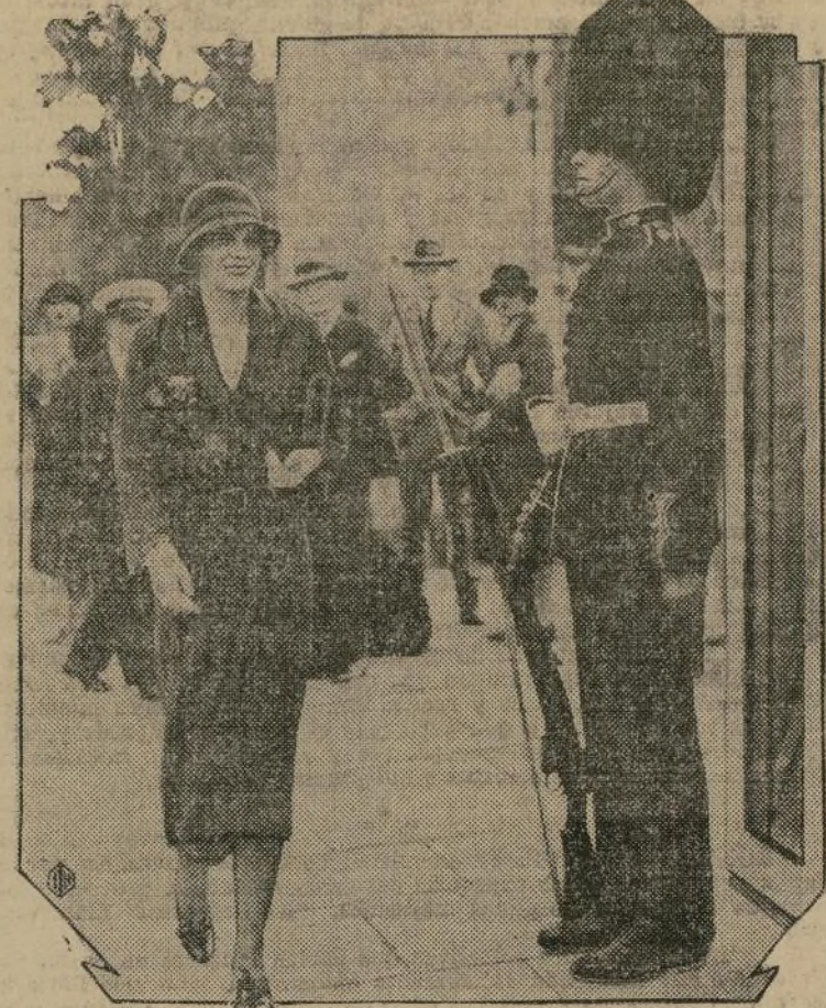
La conocida aviadora americana Amelia Earhart, penetrando en el palacio de Buckingham, en Londres, residencia de los soberanos de Inglaterra, en donde fué recibida por los reyes a raíz de su sensacional y solitario vuelo transatlántico.