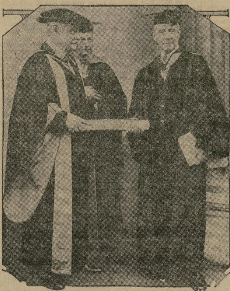
UNA DE LAS PERSONAS en recibir títulos honorarios en la 178a. graduación de la Universidad de Columbia recientemente fué el gran banquero Mr. Thomas W. Lamont, socio de la firma J. P. Morgan, quien aparece a la derecha del grabado recibiendo el diploma de manos del doctor Nicholas Murray Butler, presidente de la gran institución de enseñanza.