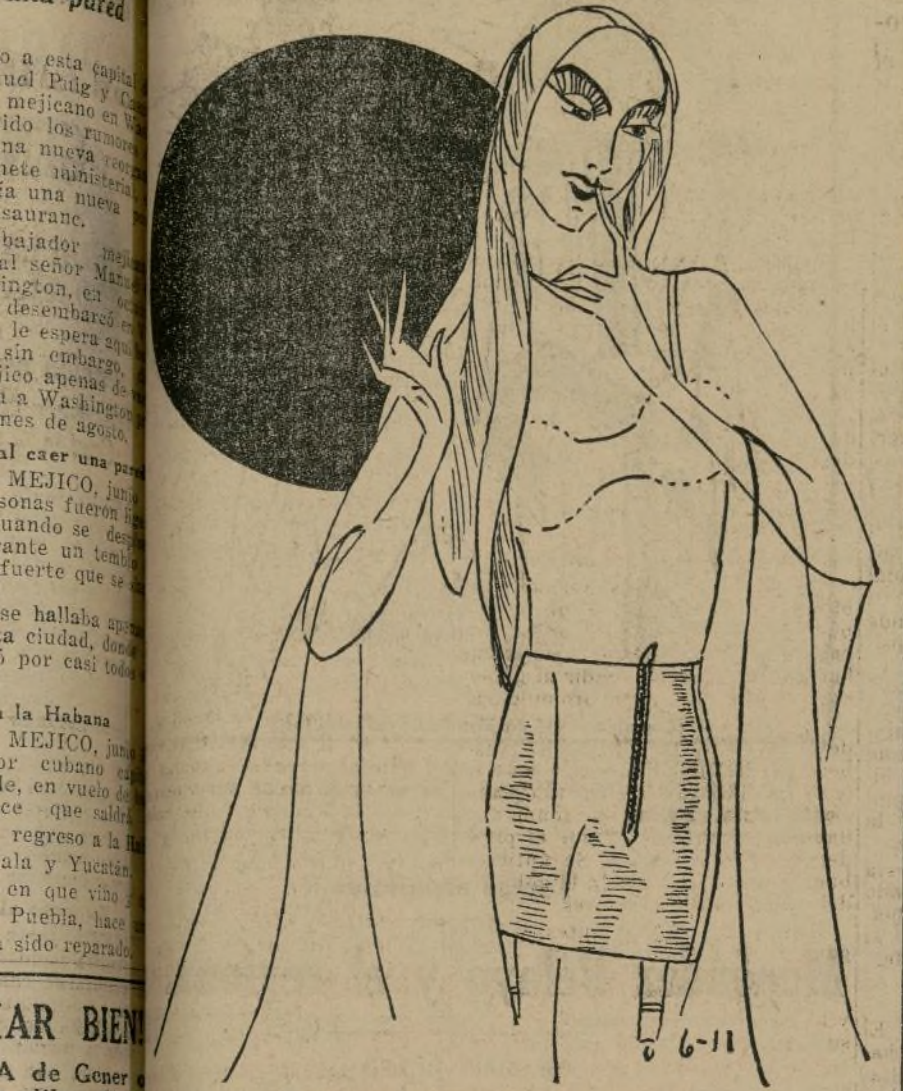
Fajas para verano, frescas y cómodas.

NEW YORK, junio 10.—Los días del verano son un problema digno de estudio para las mujeres de buen gusto. No me padece una mujer sin una corbata o con ellas enrolladas. Durante sus vacaciones de verano o en sus momentos desocupados, Cha- queñas o capitas que sirven para usarlas en las noches un poco frescas, cuando se pasean en bote o en automóvil. Resultan más baratas. Méjeme me escribe habiéndome de un precioso bolso de piel de jabalí. Este cuero resulta muy suave al palparlo, pero muy durable y de un rico color marrón. Es muy original y bonito.