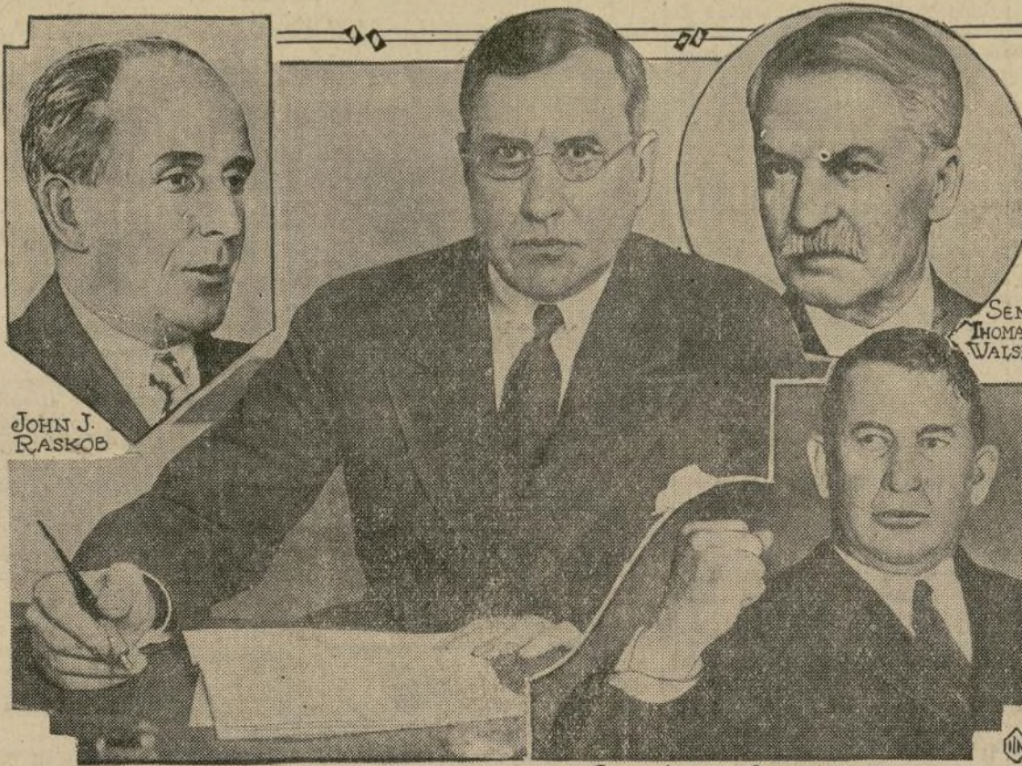
He aquí a los hombres que dirigirán la marcha de la próxima convención democrática en Chicago.