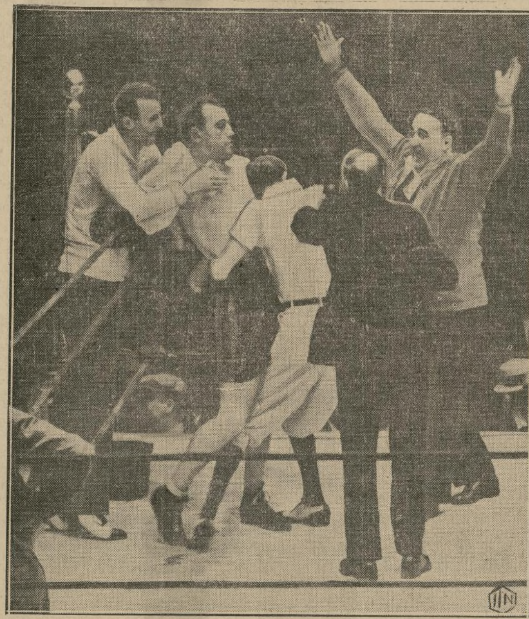
Arriba, a la izquierda, Max Schmeling (izquierda) falla un derechazo a la cabeza en el segundo asalto de la pelea, ganado por Jack; (derecha) Sharkey (calzones rayados) aparece atacando al cuerpo en pleno séptimo asalto; y abajo, regocijo en la esquina del bostoniano al anunciarse el veredicto que devolvió el campeonato mundial a los Estados Unidos.