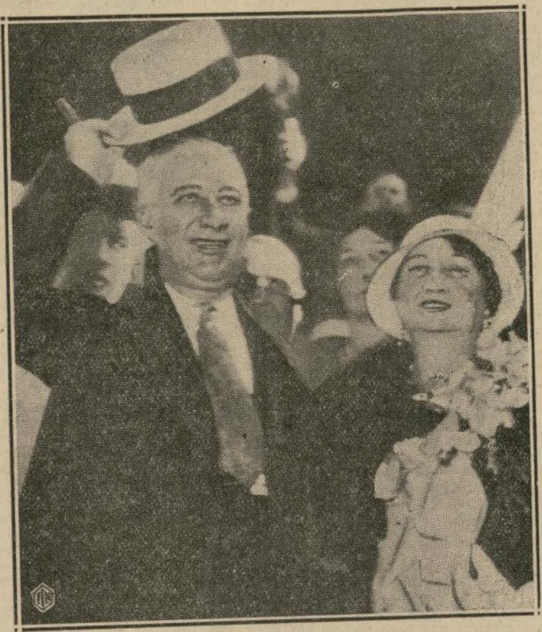
El popular "Al" Smith, acompañado por su esposa, aparece aquí en el momento en que llega a la ciudad de Chicago para asistir a la convención demócrata. Mr. Smith fue candidato a la presidencia en la elección de 1928 y nada de extraño tendría que volviera a serlo este año.