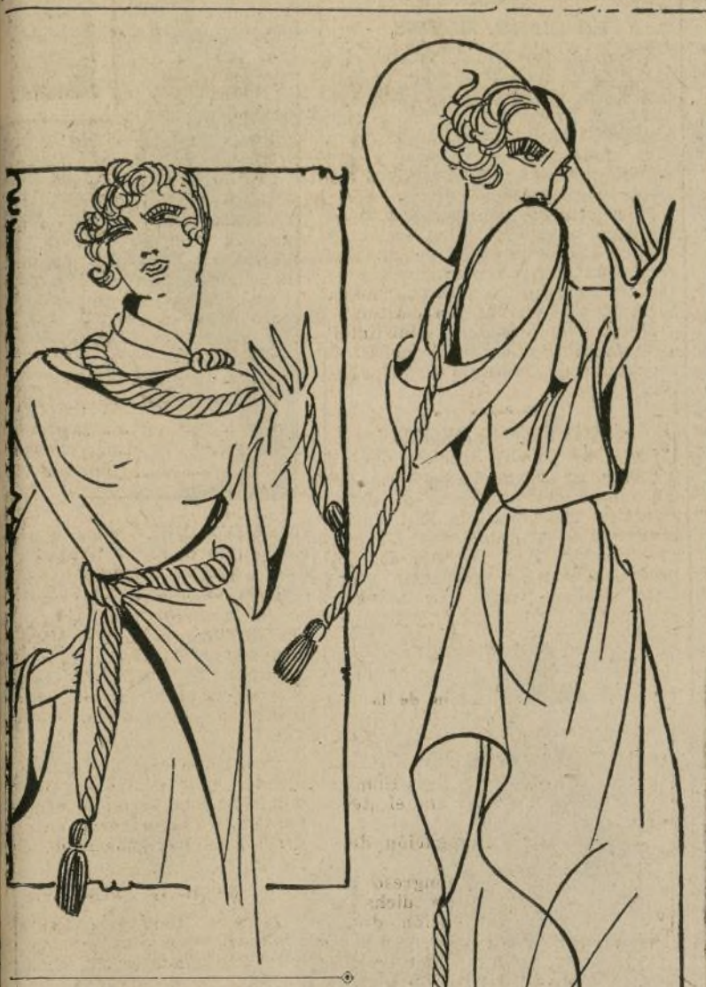
Tapado o bata para la playa en malla de lana, atada con cordones.

NEW YORK, junio 28.—La fantástica variedad que como fiebre contagiosa invadió los campos de las modas femeninas en París, hace algún tiempo, parece que regresa. En los bañeros de lujo... San Sebastián, Cannes, Niza, Biarritz, Deauville, Palm Beach y demás, las bellas bañistas lucen las más intrincadas toaletas, de original corte. Dejan correr su fantasía los creadores y las mujeres aceptan reventes los decretos.