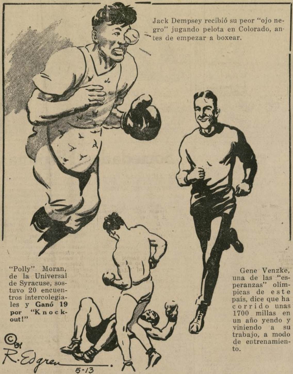
Jack Dempsey recibió su peor "ojo negro" jugando pelota en Colorado, antes de empezar a boxear.

"Polly" Moran, de la Universal de Syracuse, sostuvo 20 encuentros intercolegiales y Ganó 19 por "Knock-out!"