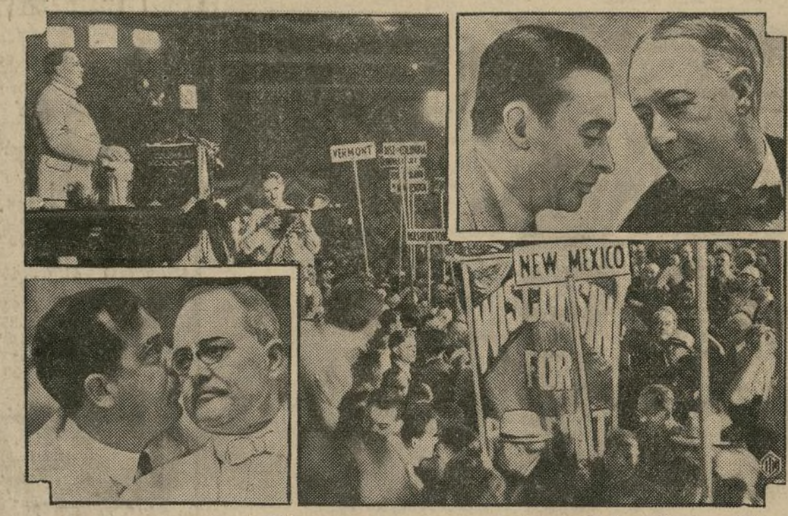
Escenas en el Stadium de Chicago, que dan elocuente testimonio de la agitación política entre los demócratas cada grupo, estudiando su mejor técnica estratégica para ver de llevar la victoria a la postulación de su respectivo candidato.