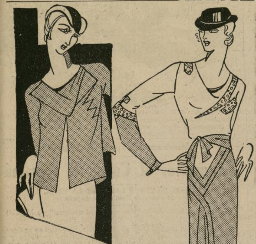
Conjunto para calle en crepe blanco y negro, muy elegante

NUEVA YORK, junio 29.—Los trajes de baño, pijamas para usarlos con ellos cuando se descanza en la arena, se ofrecen en interesante variedad.