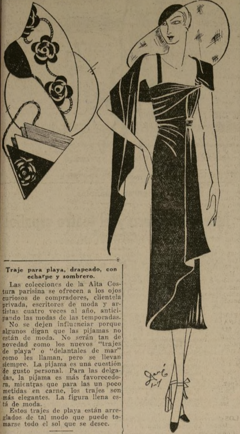
Traje para playa, drapado, con echarpe y sombrero.

Las colecciones de la Alta Costura parisina se ofrecen a los ojos curiosos de compradores, clientela privada, escritores de moda y artistas cuatro veces al año, anticipando las modas de las temporadas. No se dejan influenciar porque algunos digan que las pijamas no están de moda. No serán tan de novedad como los nuevos "trajes de playa" o "delantales de mar" como les llaman, pero se llevan siempre. La pijama es una cuestión de gusto personal. Para las delgadas, la pijama es más favorecedora, mientras que para las un poco metidas en carne, los trajes son más elegantes. La figura llena está de moda.