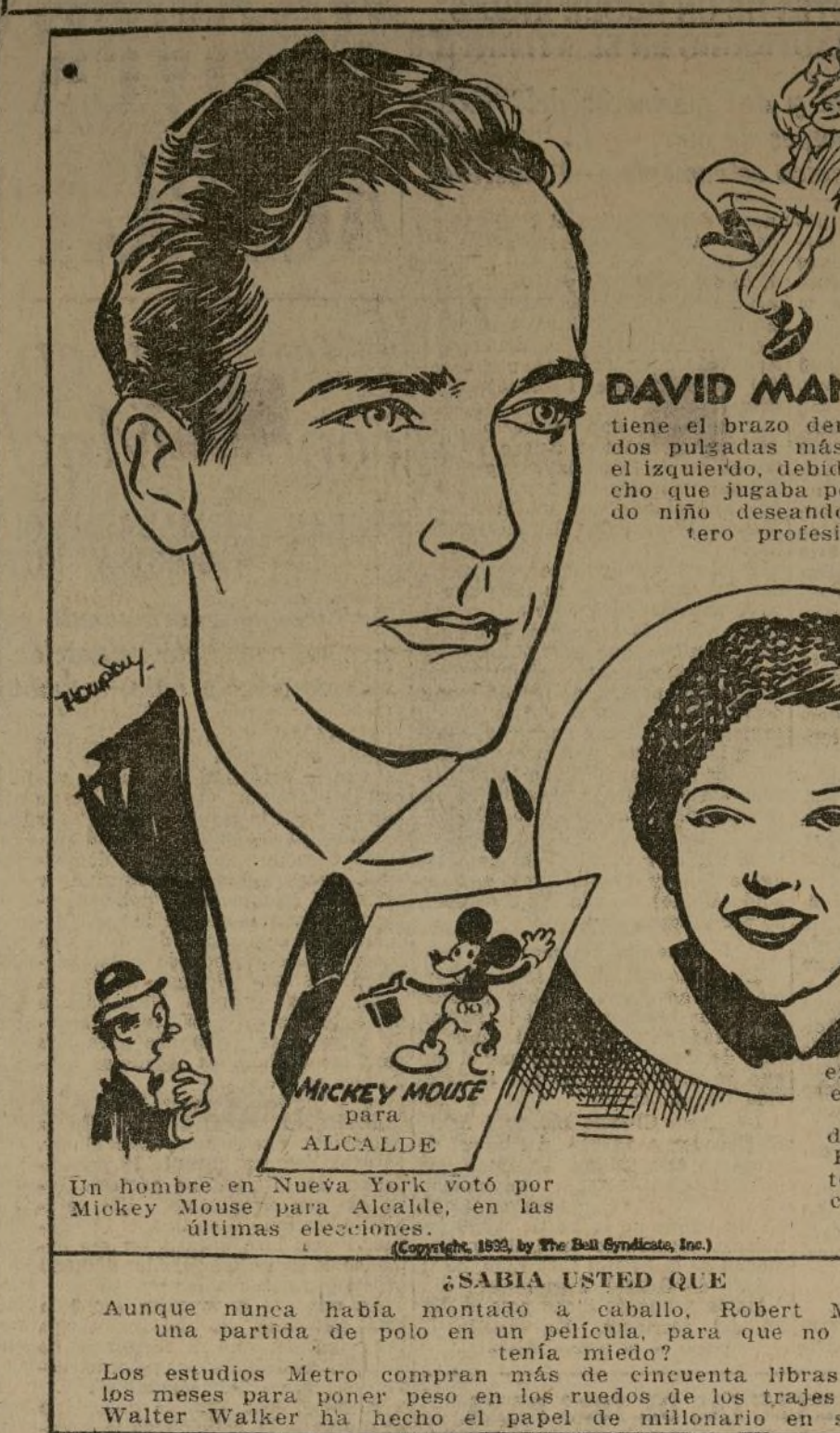
Un hombre en Nueva York votó por Mickey Mouse para Alcalde, en las últimas elecciones.