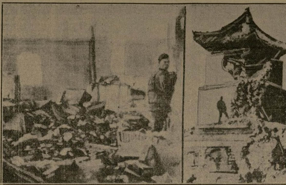
Las primeras fotografías que llegan a este país de la nueva ofensiva nipona en China. Ambas muestran un fuerte en ruinas en la gran muralla, en la ciudad de Shanhaikwan, capturada por los invasores y que es la puerta para la rica provincia de Jehol.