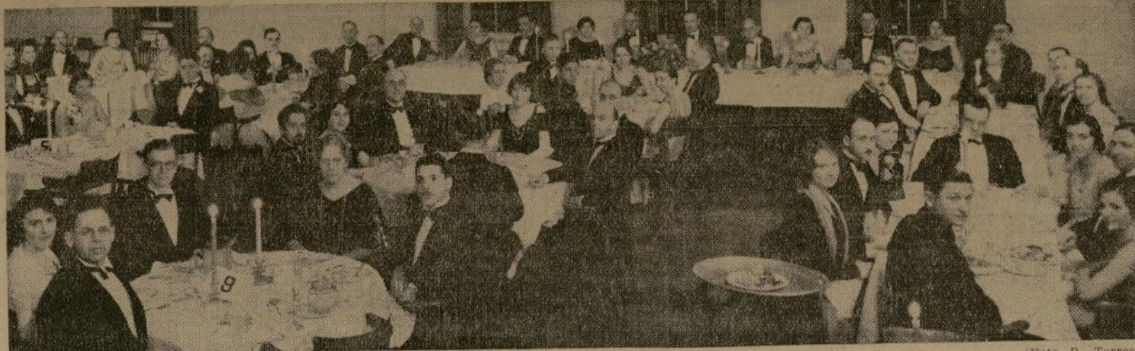
Lucida representación del Capítulo Neoyorquino de la Asociación de profesores de español, que tomó parte en el banquete-baile celebrado el sábado por la noche, en el Men's Faculty Club de la Universidad de Columbia. En señalado éxito se anotó con esta fiesta la agrupación que con tanto celo se afana en propagar en este país el idioma español y su cultura.

EL BANQUETE ANUAL DE LA ASOCIACIÓN NORTEAMERICANA DE PROFESORES DE ESPAÑOL