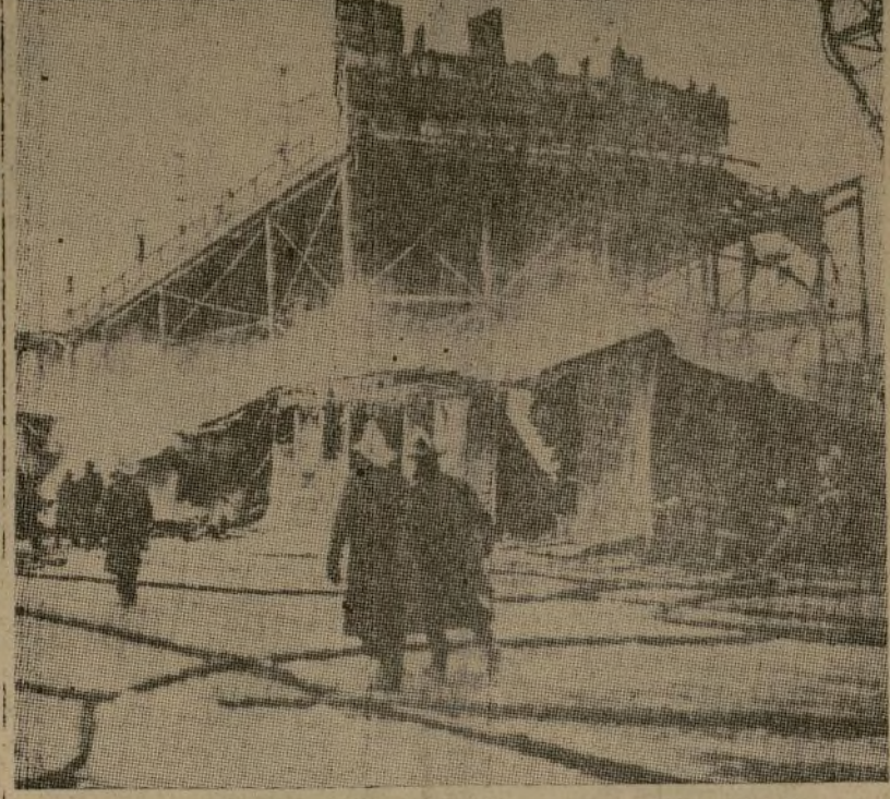
Los bomberos luchando con el incendio de ayer en Coney Island, que destruyó una manzana, causando $250,000 de pérdidas.